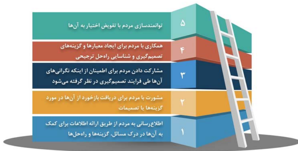
شکل ۲. سطوح مشارکت عمومی [۲۴]

- اعتقاد به ارزش مشارکت عمومی - آگاهی از اینکه دخیل شدن مردم، منجر به تصمیم‌گیری بهتر و مشارکت عمومی منجر به حکمرانی بهتر می‌شود؛ - ظرفیت مشارکت - حصول اطمینان از اینکه نهادها می‌دانند چگونه فرایندهای مشارکت عمومی را طراحی و اجرا کنند و سازمان‌ها و عموم مردم به طور نسبی دانش و مهارت‌های ارتباطی برای مشارکت مؤثر بر فرایند را دارند؛ - شفافیت کامل - به‌اشتراک‌گذاری به‌موقع اطلاعات و قابل درک بودن آن و دسترسی آسان به آموزش عمومی در مورد مسائل و گزینه‌ها؛ مشارکت عمومی باید به عنوان فرصتی برای اتخاذ یک تصمیم قدرتمند در نظر گرفته شود. تصمیمی که مسائل را با بیشترین رضایت ممکن و منافع طرف‌های ذی‌نفع حل می‌کند. هر چقدر زمان و تلاش بیشتری برای مشارکت عمومی صرف شود، سود بیشتری به همراه دارد و منجر به تصمیم قابل قبول‌تر، قابل اجرا تر و پایدارتر می‌شود.