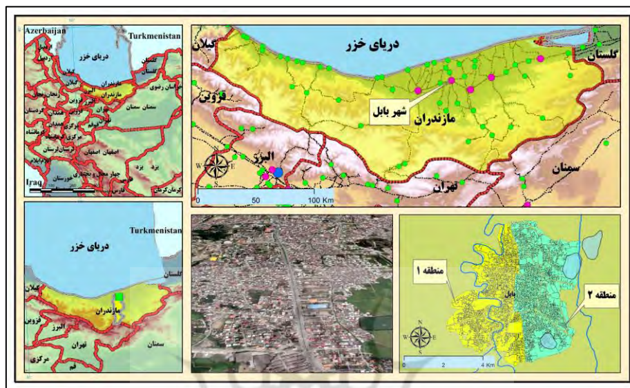
شکل ۱. محدوده و موقعیت جغرافیایی شهر بابل

شهرستان‌های قائم‌شهر و سوادکوه شمالی، از جنوب شرقی به شهرستان سوادکوه، از غرب به شهرستان آمل و از جنوب با رشته‌کوه البرز و شهرستان فیروزکوه، همسایه است. ارتفاع بابل دو متر پایین‌تر از سطح دریای آزاد و ۵۲ متر بالاتر از سطح دریای خزر می‌باشد. جمعیت این شهر ۲۵۰۲۱۷ نفر شامل ۸۱۵۷۲ خانوار و دارای ۶۶۳۰۴ واحد مسکونی می‌باشد. مساحت این شهر نیز ۳۰/۳ کیلومترمربع است (نیک‌پور و همکاران، ۱۳۹۹: ۳۹۶).