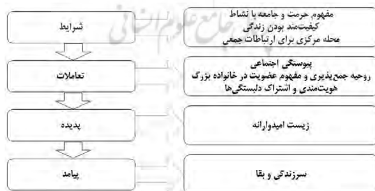
شکل ۲. مدل زمینه ای فضای شهری فرهنگی اجتماعی در محله خواجه خضر کرمان

شرایط، تعاملات و پیامد بحث شده پیرامون "مقوله هسته ای" در قالبی از مدل زمینه ای برای سرزندگی فضاهای شهری در تأثیر از فرهنگ اجتماعی (مطالعه موردی محله خواجه خضر کرمان) ترسیم شده است که می تواند الگوی