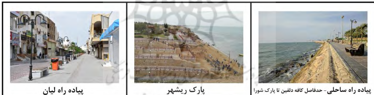
شکل ۱- وضع موجود نمونه‌های موردی

پیاده راه لیان غربی: پیاده راه لیان از شاخص‌ترین فضاهای شهر بوشهر است، این پیاده راه از شمال به محله کوتی (یکی از چهار محل بافت قدیم بوشهر)، از جنوب به مراکز خرید، از غرب به ساحل خلیج فارس و از شرق محدود به میدان انقلاب از قدیمی‌ترین و اصلی‌ترین گره‌های شهری می‌باشد. در حال حاضر قسمتی از غرب خیابان لیان، از میدان انقلاب تا تقاطع خیابان معلم به علاوه یک خیابان فرعی متقاطع با آن (دانش آموز)، حداقل پیاده‌راه لیان غربی و خیابان شهدا به حرکت پیاده اختصاص پیدا کرده اند. اگرچه این اقدام به سرزندگی فضای شهری و امنیت حضور پیاده کمک کرده است اما جزییات اجرایی، مبلمان و کفسازی این معابر متناسب با نیازهای حضور پیاده و کاربری‌های پیرامون نمی‌باشد. سرزندگی پیاده‌راه لیان در هنگام شب از نکات قابل توجه در این مسیر می‌باشد.