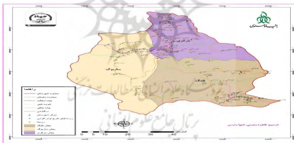
شکل ۲- نقشه موقعیت جغرافیایی و سیاسی شهرستان قصرقند و روستاهای هدف طرح آبادانی و پیشرفت

شهرستان قصرقند در محدوده ۶۰ درجه و ۱۸ دقیقه تا ۶۱ درجه و ۱۹ دقیقه طول شرقی و ۲۵ درجه و ۴۲ دقیقه تا ۲۶ درجه و ۳۲ دقیقه عرض شمالی در جنوب سیستان و بلوچستان ایران قرار دارد. ارتفاع شهرستان از سطح آب‌های آزاد دنیا ۵۰۳ متر و مساحت آن ۶۱۱۰ کیلومترمربع می‌باشد. شهرستان قصرقند دارای شرایط اقلیمی گرم و نیمه مرطوبی است و در سال‌های اخیر به دلیل کاهش نزولات جوی دچار خشک‌سالی شدیدی بوده است. قرارگیری شهرستان در مسیر مسیل رودخانه کاجو سبب شده در بخش‌هایی از سطح شهرستان در ایام گرم تابستان نیز محیطی مساعد برای گردشگران و اهالی فراهم گردد. شهرستان قصرقند در سال ۱۳۹۱ از شهرستان نیکشهر جدا و تبدیل به شهرستان شده است. این در حالی است که قدمت تأسیس بخشدار در آن به سال ۱۳۱۶ و قدمت تأسیس شهرداری به سال ۱۳۴۳ هجری شمسی برمی‌گردد. در حال حاضر شهرستان قصرقند دارای سه بخش مرکزی، ساربوک و تلنگ است (شکل ۲).