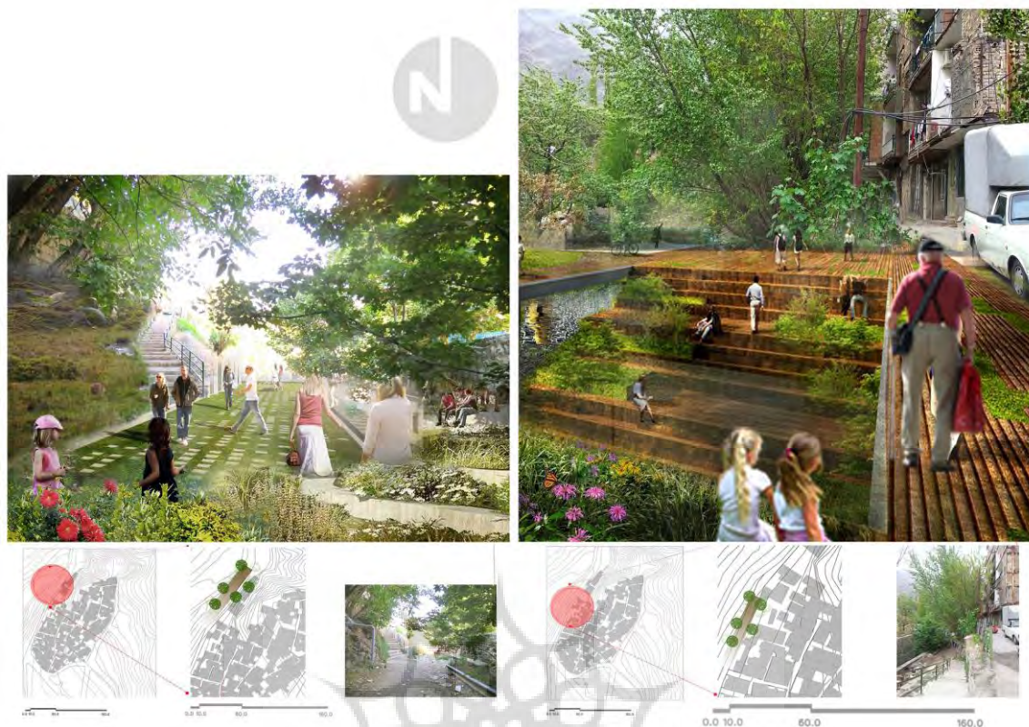
شکل ۴. ارائه راهکارها در تعدادی از نقاط بحرانی سایت