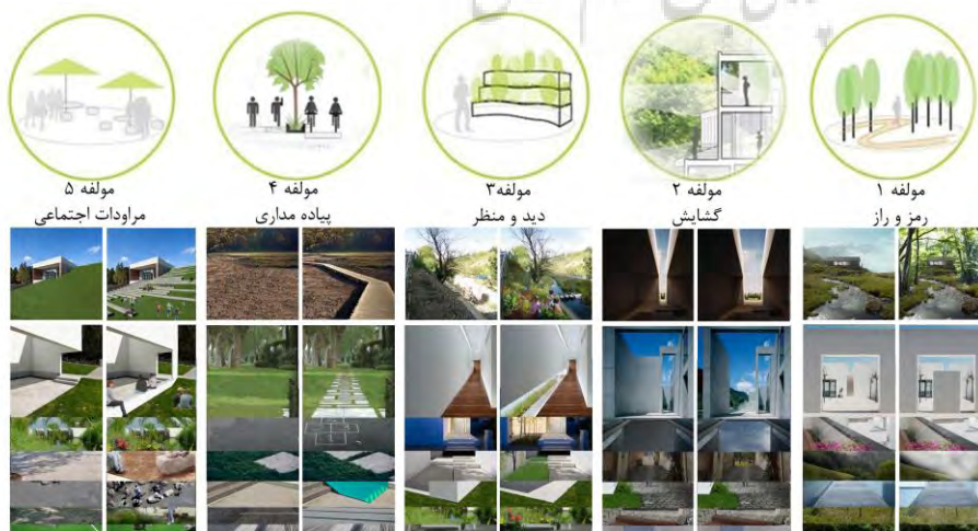
شکل ۲. محرک‌های آزمایش

E: تعدادی از متخصصان که با هر یک از گویه‌ها کاملاً موافق و یا موافق بودند. بعد از انجام کار گویه‌های با CVR < 0.49 حذف شدند (Lawshe, 1975: 568).