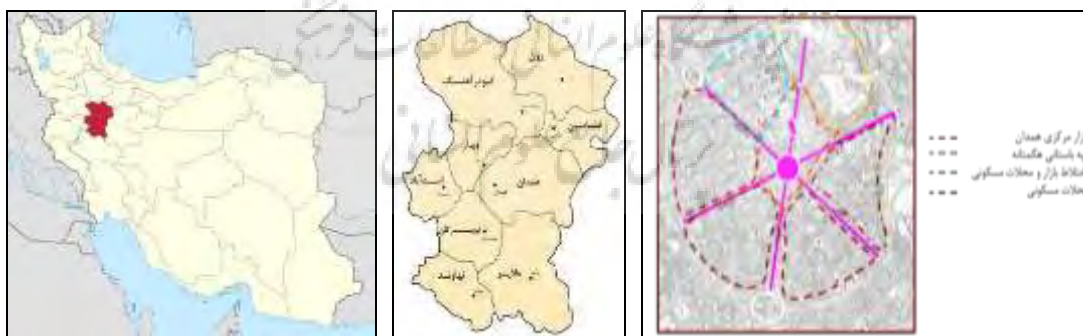
شکل ۱. موقعیت رینگ مرکزی شهر همدان و شش خیابان اصلی

دارای تفاوت معنی‌دار می‌باشند. بنابراین با یکدیگر اختلاف دارند که این آزمون را می‌توان در نمودار میانگین زیر خلاصه نماییم.