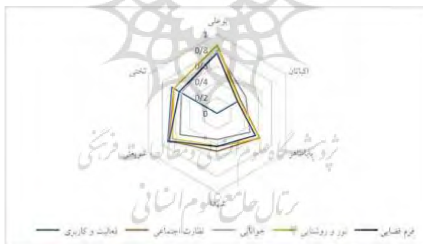
نمودار ۲. عنکبوتی مؤلفه‌های امنیت در شش خیابان شهر همدان

خیابان ایجاد نموده است و نقش آیت‌های دیگر محیطی از جمله نظارت اجتماعی، خوانایی، روشنایی و فرم فضایی می‌باشد. در بررسی سطح امنیت دیگر معابر، از نظر پاسخ‌گویان خیابان شریعتی دومین خیابان با امنیت بالا می‌باشد که فعالیت و کاربری زمین با دارا بودن ۰/۷۲ بیش‌ترین تأثیر را بر امنیت این خیابان داشته است. نقش دیگر مؤلفه‌های محیطی از جمله نظارت اجتماعی، خوانایی، نور و فرم فضا، می‌باشد. از دیدگاه پاسخ‌گویان سومین خیابان از نظر امنیت خیابان تختی می‌باشد فعالیت و