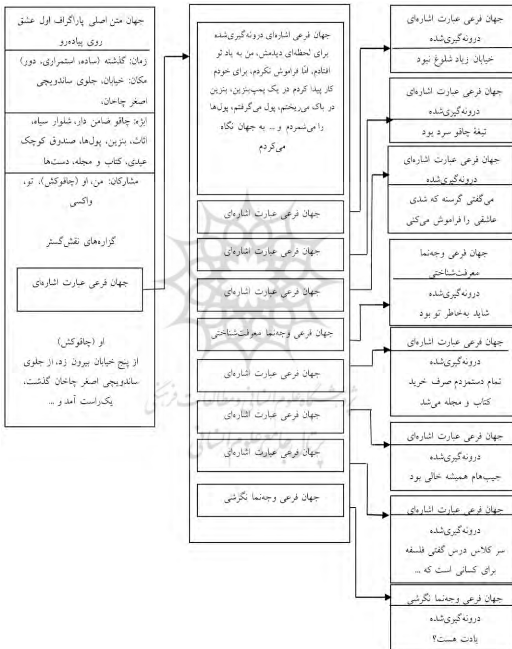
جدول (۳). جهان‌های فرعی بند نخست داستان عشق روی پیاده‌رو (مستور، ۱۳۹۰: ۶۵-۷۷)

شخص گستر و دو نمونه گزاره ربطی موجود در این بند مانند: «به فکر یک لقمه نان باش...» و «گرسنه که شدی عاشقی را فراموش می‌کنی» کارکرد موضوع گستر دارند.