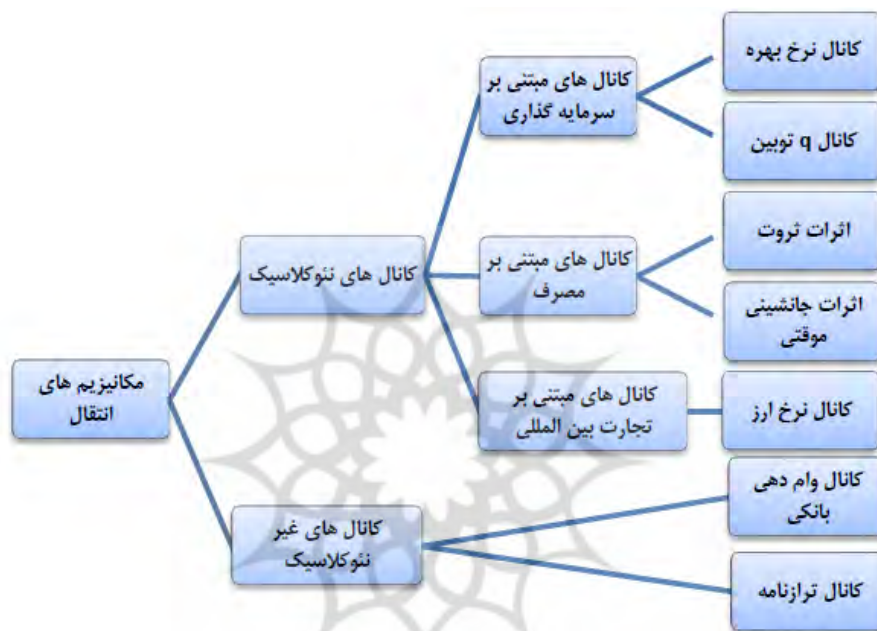
شکل ۱. سازوکارهای انتقال پولی

سوم، عکس‌العمل شرایط مالی به تغییرات سیاست‌ها (حتی بدون در نظر گرفتن تغییرات ناشی از عوامل غیرسیاست‌گذاری شده) ممکن است تغییر کند. چهارم اینکه، عوامل دیگری غیر از شرایط مالی، عملکرد واقعی اقتصاد را تحت تأثیر قرار می‌دهند. مانند تغییرات بهره‌وری، قیمت کالاها و مدیران کسب و کار. در حالی که برای تمام آن‌ها اثرهای مالی وجود دارند، فرضیه‌ای قوی در خصوص ارتباط بدون واسطه آن‌ها به شاخص مالی نیز وجود دارد.