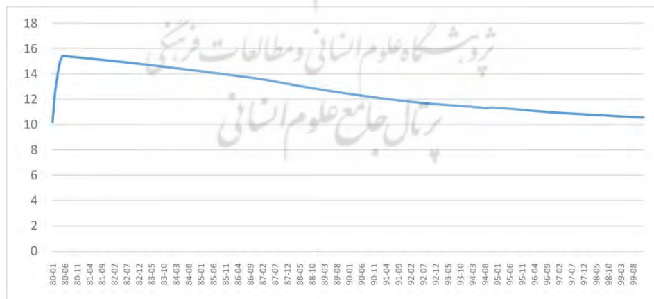
شکل ۲. میانگین تعداد متغیرهای به کار برده شده در هر مقطع بر اساس مدل میانگین پویای متحرک در مدل خود رگرسیون برداری عاملی تعمیم‌یافته پارامتر متغیر زمانی

بر اساس شکل ۲، مشاهده می‌شود تعداد متغیرهای مالی که انتخاب آن‌ها برای به کار بستن در شاخص شرایط مالی امکان‌پذیر است، تقریباً تا نیمه اول سال ۸۸ روند افزایشی دارد و پس از آن، روند کاهشی پیدا می‌کند.