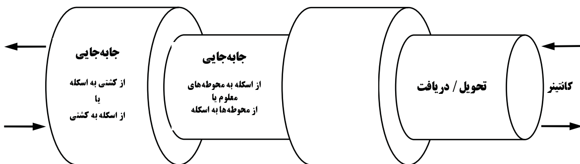
شکل ۱- زیرسامانه‌های یک پایانه‌ی کانتینری [2]

(در شکل ۱، این زیرسامانه‌ها نشان داده شده است.) سه عنصر کلیدی "نیروی کار، تجهیزات و زمین" در عملیات هر یک از این زیرسامانه‌ها دخیل می‌باشد و در پربازده ساختن یا سودمند کردن زیرسامانه‌های پایانه‌ی کانتینری و در نهایت کل پایانه تاثیر مستقیم دارند. به گونه‌ای که هدف پایه‌ای مدیریت یک پایانه کانتینری باید به‌کارگیری پربازده و استفاده مناسب از این سه منبع کلیدی در زیرسامانه‌های پایانه باشد. در تدوین استراتژی‌ها و اهداف بلندمدت در