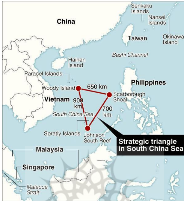
نقشه دریای جنوب چین