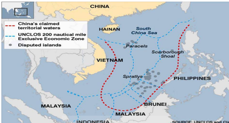
نقشه جزایر اسپراتلی و پاراسل