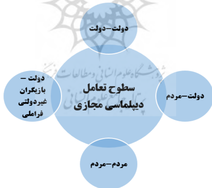
شکل (۳): سطوح تعامل دیپلماسی مجازی

و گزارش دهی از تحولات، گسترش روابط و امور کنسولی (گرک، ۲۰۰۶: ۱۷-۱۵). این کارکردها بطور نسبی در دیپلماسی مجازی نیز دیده می‌شوند. بدیهی است این کارکردها جایگزین کارکردهای دیپلماسی سنتی نشده و بموازات آن و به‌صورت مکمل مدنظر قرار می‌گیرند. گرچه در برخی حوزه‌ها از جمله ارائه خدمات کنسولی و دیپلماسی عمومی مورد اقبال قرار گرفته و بخش قابل توجهی از این خدمات به فضای مجازی منتقل و جایگزین بخشی از رویه‌های اداری سابق شده است. ضمن اینکه باید اذعان داشت مراجع قضائی بین‌المللی نسبت به کارکردهای دیپلماسی مجازی با تردید بیشتری می‌نگرند. به‌گونه‌ای که در گزارش کمیسیون حقوق بین‌الملل در سال ۲۰۱۱ در خصوص حق شرط (پله، ۲۰۱۱: ۲۴) عنوان می‌شود حق شرط‌های اعلامی کشورها از طریق پست الکترونیک در صورتی قابلیت استناد در مراجع قضائی بین‌المللی را دارند که در زمان مشخصی از طریق یادداشت رسمی مورد تأیید قرار گیرند (ممتاز، ۱۳۹۸). در دیپلماسی مجازی با افزایش نقش بازیگران غیردولتی، سطوح تعامل جدیدی در دیپلماسی به وجود آمده که در شکل زیر نمایش داده شده است: