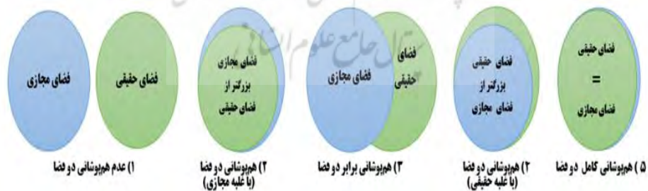
شکل (۱): حالت‌های متصور تعامل دو فضایی

بن مایه ۳ دو فضائی تأکید می‌کند که فهم واقعیت‌های جوامع انسانی با بن‌مایه‌های تک جهانی ممکن نیست و فهم جهان واقعی منهای درک جهان مجازی و بالعکس، مطالعه جهان مجازی بدون توجه به متغیرهای جهان واقعی، مطالعه را گرفتار نوعی خطای فهم می‌کند (عاملی، ۱۳۹۶: ۲۱۹). میزان ارتباط انسان‌ها با فضای مجازی تابع متعددی از جمله ظرفیت‌های این فضا در پاسخگویی به نیازهای بشر است. با در نظر گرفتن این امر برای تعامل دو فضای حقیقی و فضای مجازی پنج حالت می‌توان تصور کرد. از بین آن‌ها دو حالت عدم تداخل و هم‌پوشانی کامل، وجود خارجی ندارد. بلکه حالت واقعی، تداخل و هم‌پوشانی این دو فضا است. هم‌پوشانی نیز نسبی بوده و با غلبه یکی بر دیگری یا تداخل برابر تصور است. این حالت‌ها در شکل (۱) نمایش داده شده است.