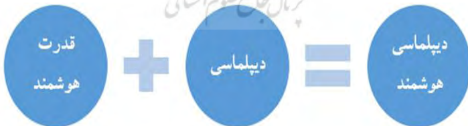
شکل (۲): ترکیب دیپلماسی هوشمند

دیپلماسی هوشمند از جدیدترین تعبیر رواج یافته در ادبیات روابط بین‌الملل در سال‌های اخیر است که برای اولین بار در سال ۲۰۰۹ توسط هیلاری کلینتون وزیر وقت امور خارجه آمریکا مطرح شد. دیپلماسی هوشمند، حاصل هم‌افزایی قدرت هوشمند و دیپلماسی است (ایزدی و تکبیری، ۱۳۹۳: ۳۹-۳۸). مفهوم قدرت هوشمند ۱ بعنوان ترکیبی از قدرت سخت و نرم برای دستیابی به اهداف در روابط بین‌الملل توسط جوزف نای معاون وزیر دفاع و نظریه پرداز آمریکائی مطرح شد. وی معتقد است نه قدرت نرم و نه سخت به تنهایی نمی‌تواند سیاست خارجی مؤثر تولید کند. دیپلماسی هوشمند به معنی کاربرد همزمان و ترکیبی از قدرت سخت و نرم در دیپلماسی است که با بهره‌گیری از تمام ابعاد دیپلماسی و ظرفیت‌های مادی و معنوی به نقش‌آفرینی در عرصه بین‌المللی می‌پردازد. با بهره‌گیری از این نوع دیپلماسی، دولت‌ها بعنوان بازیگران اصلی عرصه نظام بین‌الملل، در عین سهولت در تصمیم‌گیری به دلیل گستردگی ابزار و اطلاعات در اختیار، سرعت عمل بالایی نیز داشته و با دقت فراوان در عرصه اجرای تصمیمات و بازخورد گیری حاضر می‌شوند. در شکل (۲) رابطه دیپلماسی هوشمند با قدرت هوشمند و دیپلماسی نمایش داده شده است: