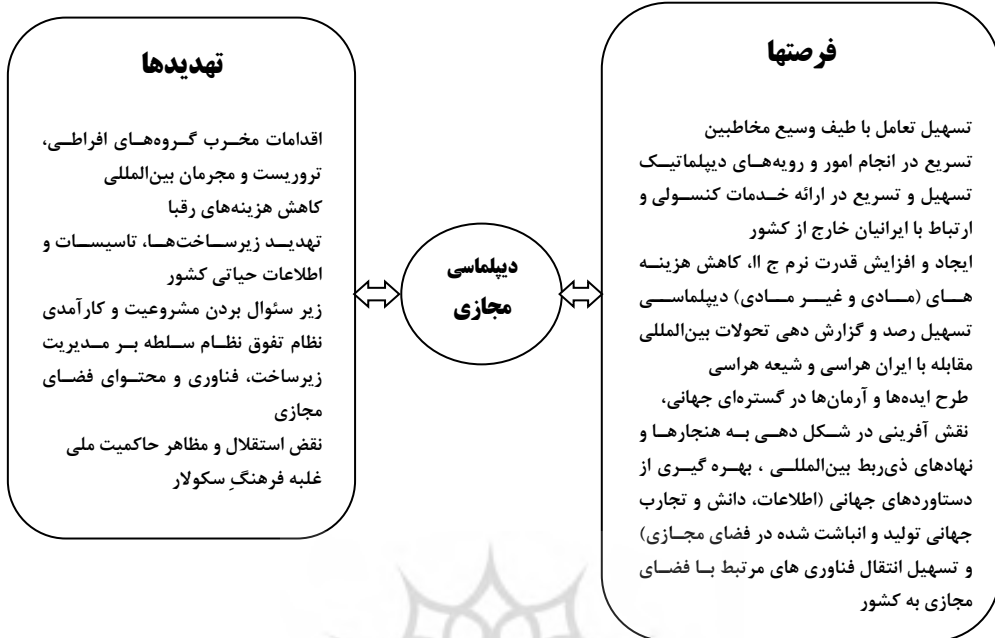
شکل (۴) - فرصتها و تهدیدهای دیپلماسی مجازی