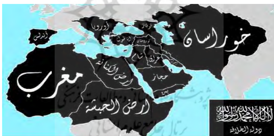
نقشه ۲: سرزمین‌های مورد ادعای داعش برای تشکیل خلافت اسلامی (شبکه خبر، ۱۳۹۳)

ابوبکر بغدادی در یک پیام صوتی خطاب به مسلمانان جهان، از آن‌ها خواست برای "جهاد مقدس" و برقراری "دولت اسلامی" او را یاری کنند و به عراق و سوریه مهاجرت نمایند (ایران گلوبال، ۲۰۱۴). تأکید داعش بر خلافت اسلامی در جغرافیای کشورهای اسلامی، وحدت ملی و تمامیت ارضی عراق و تمامی کشورهای منطقه را با خطر جدی روبه‌رو کرده است (کیهان، ۱۳۹۳). در مقابل ایده داعش مبنی بر تشکیل