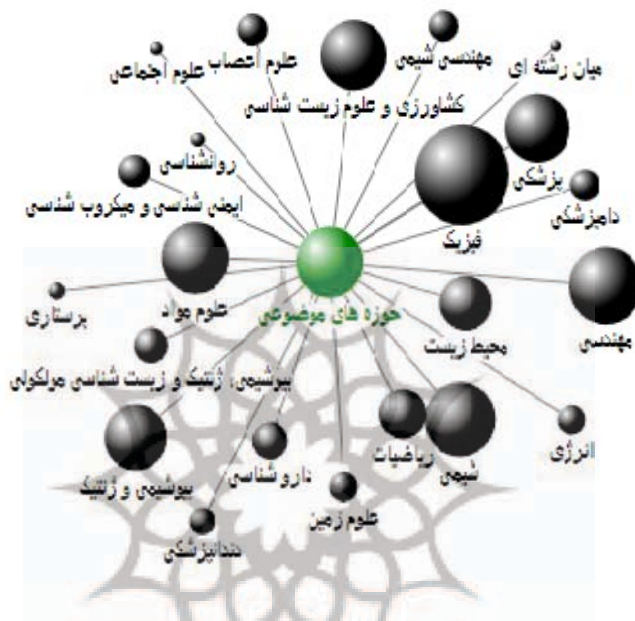
شکل ۳. حوزه‌های موضوعی مدارک منتشر شده ایران و هفت کشور در حال توسعه

در رابطه با زبان مدارک مشترک منتشر شده نیز باید اشاره کرد که بخش قابل توجهی از این مدارک به زبان انگلیسی بوده (بیش از ۹۸/۹ درصد) و تنها ۴۹ مدرک (حدود ۱/۱ درصد) به زبانی غیر از انگلیسی منتشر شده‌اند. زبان‌های این مدارک عبارتند از: ترکی (۱۳ مورد)، لهستانی (۷ مورد)، اسپانیولی (۵ مورد)، فرانسوی، عربی و کروات (۴ مورد)، آلمانی و فارسی (۳ مورد)، چینی و پرتغالی (۲ مورد)، مالزیایی و لیتوانیایی (۱ مورد). همچنین در رابطه با نوع مدارک منتشر شده نیز باید بیان داشت که بخش قابل توجهی از آن‌ها در قالب مقاله مجله به چاپ رسیده است. در رابطه با وابستگی سازمانی پژوهش‌گران جمهوری اسلامی ایران در زمینه همکاری‌های علمی با کشورهای در حال توسعه باید اشاره کرد که دانشگاه آزاد اسلامی، دانشگاه تهران و دانشگاه علوم پزشکی تهران، بیشترین میزان همکاری‌های صورت گرفته را به خود اختصاص داده‌اند. نام ۵ مرکز اصلی پرکار در این خصوص و نیز میزان همکاری‌های صورت گرفته در جدول ۵ قابل مشاهده است.