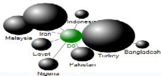
شکل ۱. میزان تولیدات علمی کشورهای در حال توسعه (D8)

در جدول ۲، میزان تولیدات علمی پژوهش‌گران هشت کشور در حال توسعه، با توجه به استانداردسازی بر مبنای جمعیت کشورها و نیز تولید ناخالص داخلی مشخص شده است. با استانداردسازی صورت گرفته مشخص شده است که میزان تولیدات علمی پژوهش‌گران کشور ما، بر حسب جمعیت، پایین‌تر از کشورهای ترکیه و مالزی قرار گرفته است. در واقع باید اشاره کرد که طی سال‌های مورد بررسی، ۲۵۳/۷۲ مقاله به ازای هر یکصد هزار نفر جمعیت، در کشور تولید شده است. در رابطه با میزان تولیدات علمی صورت گرفته پژوهش‌گران جمهوری اسلامی ایران بر اساس تولید ناخالص داخلی نیز باید اشاره کرد که ۳۹/۴۱ مقاله به ازای هر یکصد میلیون دلار منتشر شده است. این میزان برای ترکیه ۳۶/۴۴ مقاله و برای نیجریه ۱/۸ مقاله بوده است.