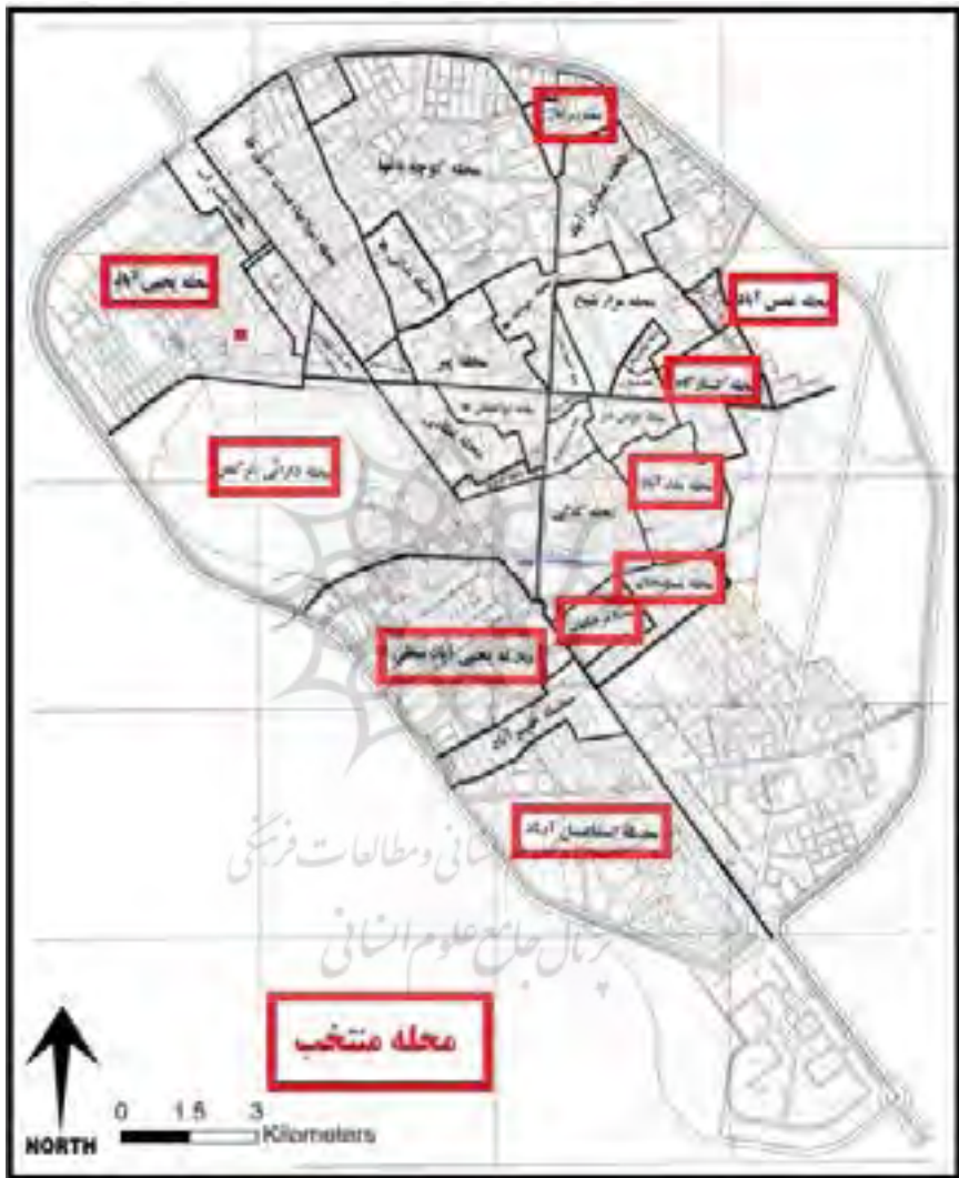
شکل (۳) محلات مورد مطالعه در شهر تربت جام