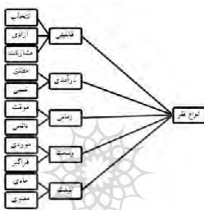
شکل (۱) انواع فقر

اولین رویکرد، نگاه پولی به فقر است. در این معنا، فقر عمدتاً کمبود درآمد و ناتوانی افراد برای تأمین حداقلی از تأمین معاش است. ساده‌ترین ابزار برای شناسایی و مطالعه این نوع فقر، تعیین موقعیت افراد نسبت به خط فقری است که به صورت سالانه و یا دوره‌های بلندمدت‌تری تعیین و مشخص می‌شود. چشم‌انداز نظری و منظر دیگر نگاه به فقر، رویکرد قابلیت است. این منظر بیشتر به شرایط و فرصتهایی اشاره دارد که افراد در اختیار دارند تا زندگی و معاش خود را تأمین کنند. در این مفهوم، فقیر کسی است که تواناییهای لازم