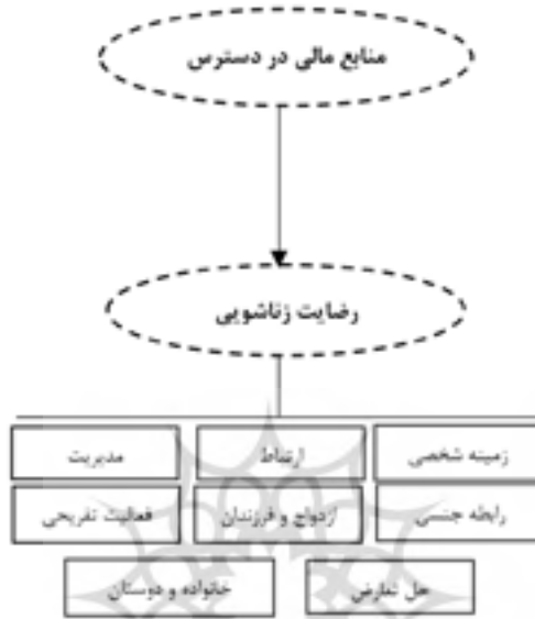
شکل (۱) مدل نظری تحقیق