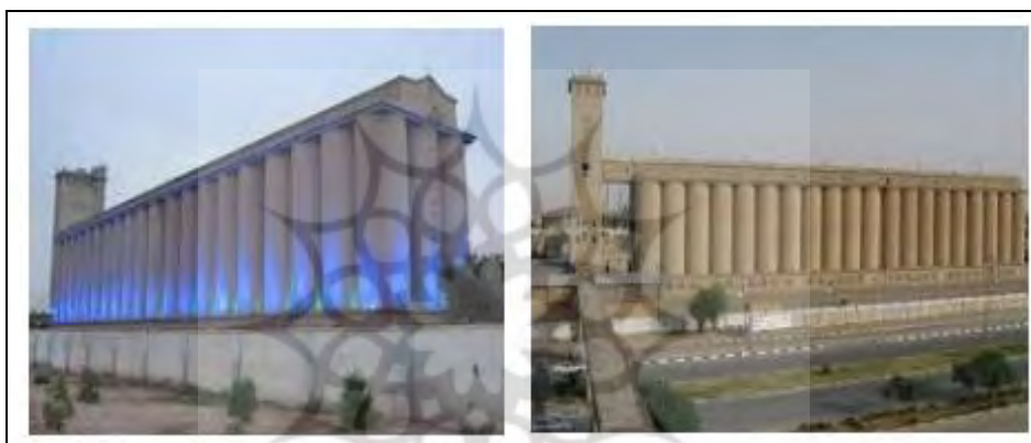
شکل ۳: ساختمان سیلو