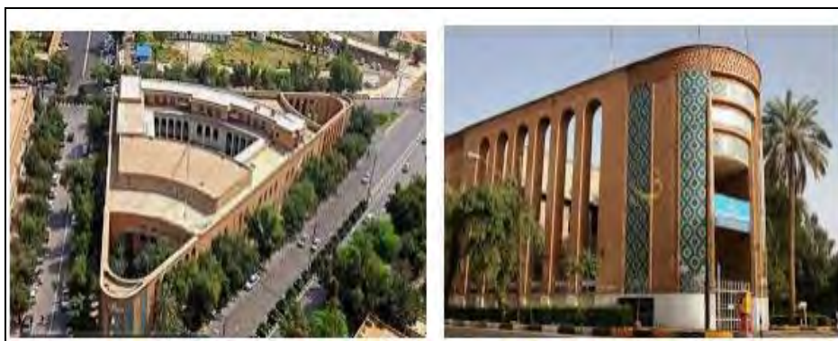
شکل ۲: ساختمان دانشکده سه گوش