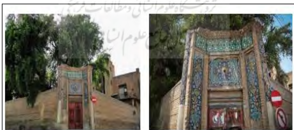
شکل ۴: ساختمان هتل قو