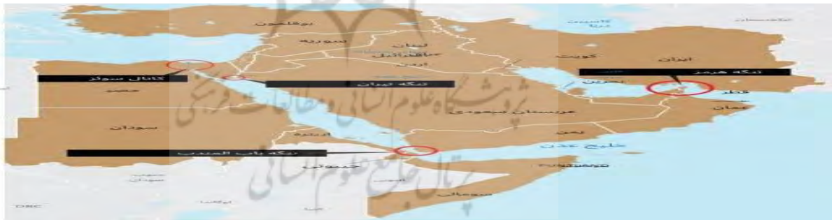
شکل ۱: موقعیت جغرافیایی یمن در مناطق استراتژیک

در سال ۲۰۱۱ موجی از انقلاب‌ها منطقه شمال آفریقا و غرب آسیا را در نوردید. بهار عربی از تونس آغاز شد و به مصر، لیبی و بعد از آن یمن سرایت کرد. رژیم صالح حدود چهار دهه بر یمن حاکم بود و فسادهای سیاسی و اداری حاکم بر آن، موجب چنددستگی‌های سیاسی در یمن شد. (هدایتی شهیدانی و بابایی، ۱۳۹۹: ۱۳۳) با آغاز قیام‌های مردمی در یمن، کشورهای عربی حوزه خلیج فارس به‌ویژه عربستان سعودی در ابتدا بر حفظ صالح تأکید داشتند؛ اما با اوج‌گیری قیام مردمی در این کشور، در نهایت این شورا با چراغ‌سبز آمریکا، با ارائه طرحی تمایل خود را به حمایت از کناره‌گیری آرام صالح نشان داد. این طرح دو هدف عمده داشت: نخست آنکه، دولتی همسو با خواست شورای همکاری خلیج فارس در یمن تشکیل شود و دوم، صالح خروجی آبرومندانه از قدرت داشته باشد تا سرنگونی وی، نه تنها الگویی برای سایر ملت‌های منطقه نشود، بلکه حتی با مدل‌سازی از یمن، تحولات سایر کشورهای عربی را نیز مدیریت کنند. این ابتکار که در ۱۶ آوریل ۲۰۱۱ از سوی وزرای خارجه شورای همکاری در ریاض اعلام شد، متضمن انتقال اختیارات صالح به معاون وی و تشکیل دولت از سوی اپوزیسیون یمن در یک فرایند زمانی مشخص بود. (مددی، ۱۳۹۶: ۹۷) در نتیجه آن، علی عبدالله صالح از قدرت کنار رفت و معاونش، عبدربه منصور هادی، زمام دولت انتقالی را به دست گرفت. با این حال، انتخاباتی برای انتقال قدرت انجام