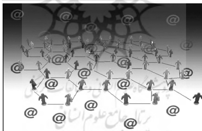
تصویر شماره ۳- مدل شبکه‌های اجتماعی نسل سوم: شبکه‌های اجتماعی دیجیتال

ابزارهای سه‌گانه‌ای که سبب شکل‌گیری شبکه‌های اجتماعی دیجیتال (Digital Social Networks) شد نیز همان مختصات ابزارهای شبکه‌های اجتماعی راه دور (یعنی پست، تلگراف و تلفن) را داشت، اما به قول شپارد، دیگر آن‌گونه کند و پرزحمت نبود (Shepard, 2007: 152). این ابزارها برای شبکه‌های اجتماعی دیجیتال عبارت بودند از: ۱- اینترنت، ۲- رسانه‌های اجتماعی و ۳- تلفن همراه. تصویر شماره ۳ حامل مدل بازسازی شده‌ای از این نسل از شبکه‌های اجتماعی است.