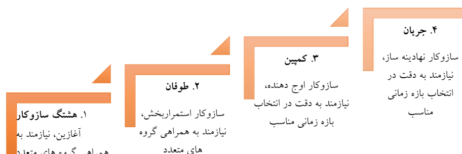
نمودار شماره ۱: سازوکارهای جریان‌سازی در شبکه‌های اجتماعی دیجیتال

مشروط به تامین شش شرط پیش گفته است. نمودار شماره ۱ گویای این یافته محوری در مقاله پیش روست.