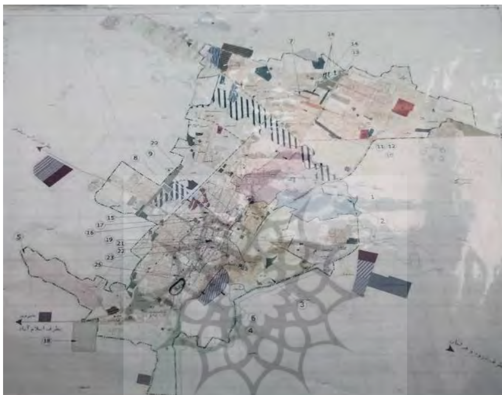
Figure 3: Endowments of Kermanshah City

این داده‌ها نشان می‌دهند به لحاظ فضایی، گستره‌ای وسیع از شهر کرمانشاه، متأثر از نهاد وقف بوده است که بسیاری از محلات حاضر شهر کرمانشاه را در بر می‌گیرد. مهم است مشخص شود ساخت‌وساز در اراضی چگونه صورت پذیرفته است؛ زیرا بخش اساسی این محلات، در حال حاضر جزو محلات حاشیه‌نشین شده شهر کرمانشاه هستند.