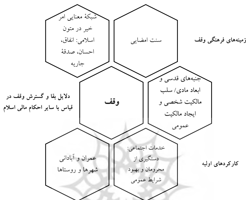
Figure 1: Meaning channel of endowment phenomena in Islam beginning and its faculty in production of urban and rural spaces

فراموش کرد نظم سیاسی، نظم اجتماعی و در عین حال، درهم تنیده با متابولیسم اقتصادی نیز هست. در واقع حکمرانی وقف، تابع نظم سیاسی درون شیوه تولید است؛ از این رو، نظام معنایی که وقف را در صدر اسلام، مفصل بندی می کند، در شکل شماره ۱ ارائه شده است.