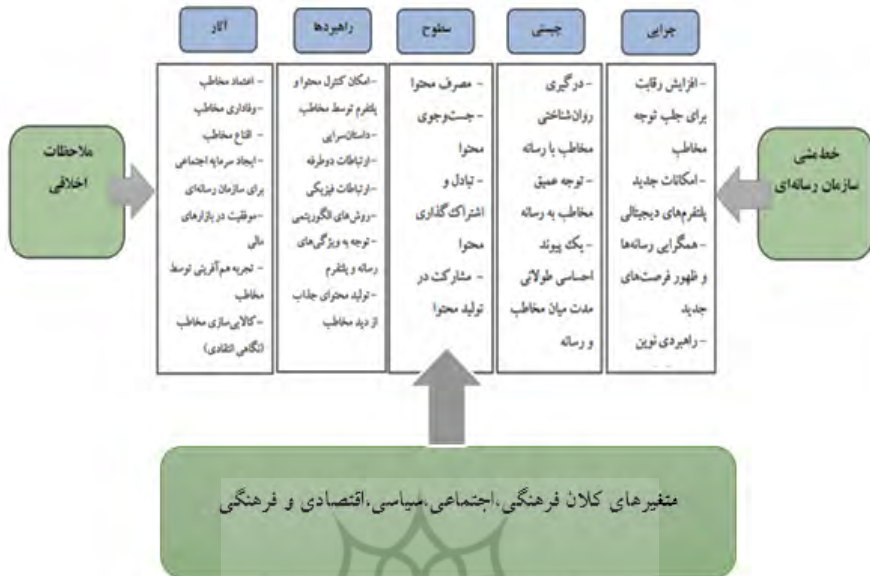
شکل ۱. چارچوب مفهومی درگیرسازی مخاطب (خواجه‌ئیان و همکاران، ۱۳۹۸: ۴۹)