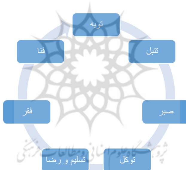
شکل ۲. مراحل