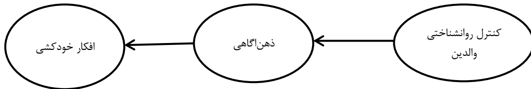
شکل ۱. مدل مفهومی پژوهش حاضر

در مورد نقش کنترل روانشناختی و به ویژه سازوکار تاثیرگذاری آن که از طریق تاثیر بر عوامل شناختی و ذهن آگاهی صورت می گیرد مورد بررسی قرار نگرفته است. با توجه به تاثیرات ذهن آگاهی بر افکار خودکشی، توجه به تاثیرگذاری کنترل روانشناختی والدین در افکار خودکشی از طریق ذهن آگاهی می تواند در جهت اقدامات و مداخلات لازم، مفید واقع شود که البته این مهم، در مطالعات پیشین مورد توجه قرار نگرفته است. بنابراین با توجه به مباحث فوق، هدف پژوهش حاضر، تعیین نقش واسطه ای ذهن آگاهی در رابطه بین کنترل روانشناختی والدین و افکار خودکشی است. مدل مفهومی پژوهش حاضر در شکل ۱ آورده شده است.