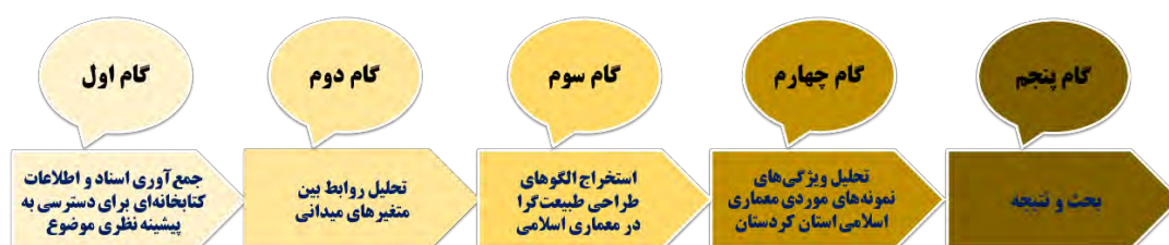
تصویر ۱. گام‌های انجام پژوهش

روش جمع‌آوری اسناد و تحلیل روابط بین متغیرهای میدانی، توصیفی - تحلیلی می‌باشد. با توجه به میدانی بودن این تحقیق، از روش جمع‌آوری اطلاعات کتابخانه‌ای برای دسترسی به پیشینه نظری موضوع و از روش جمع‌آوری اطلاعات میدانی برای جمع‌آوری اطلاعات کالبدی بهره گرفته شده است.