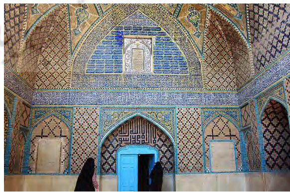
تصویر ۱۱. نمای سر در ورودی و ستون‌های مسجد