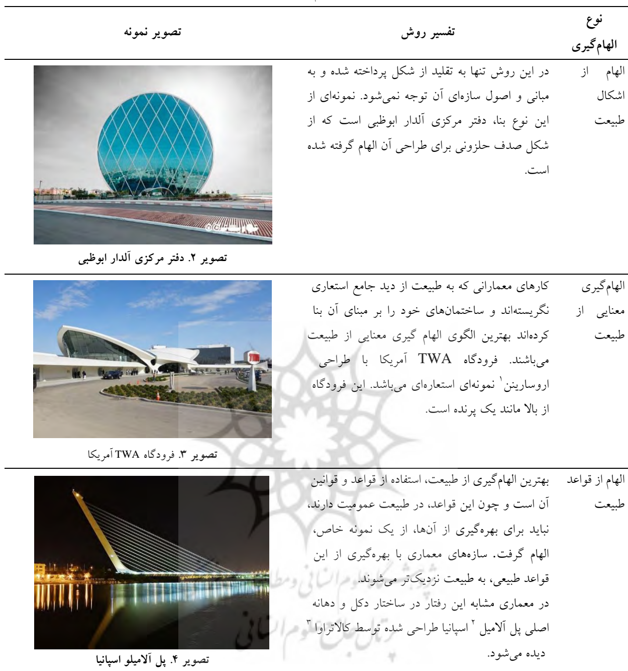
تصویر ۲. دفتر مرکزی آلدار ابوظبی