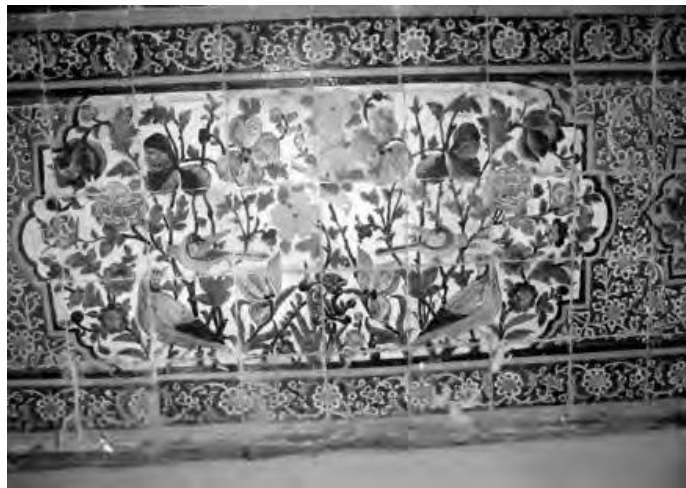
تصویر ۹. کاشی کاری با نقش گل و بلبل در ازاره‌ی غرفه ضلع شرقی بینه حمام خان (زارعی، ۱۳۹۱)