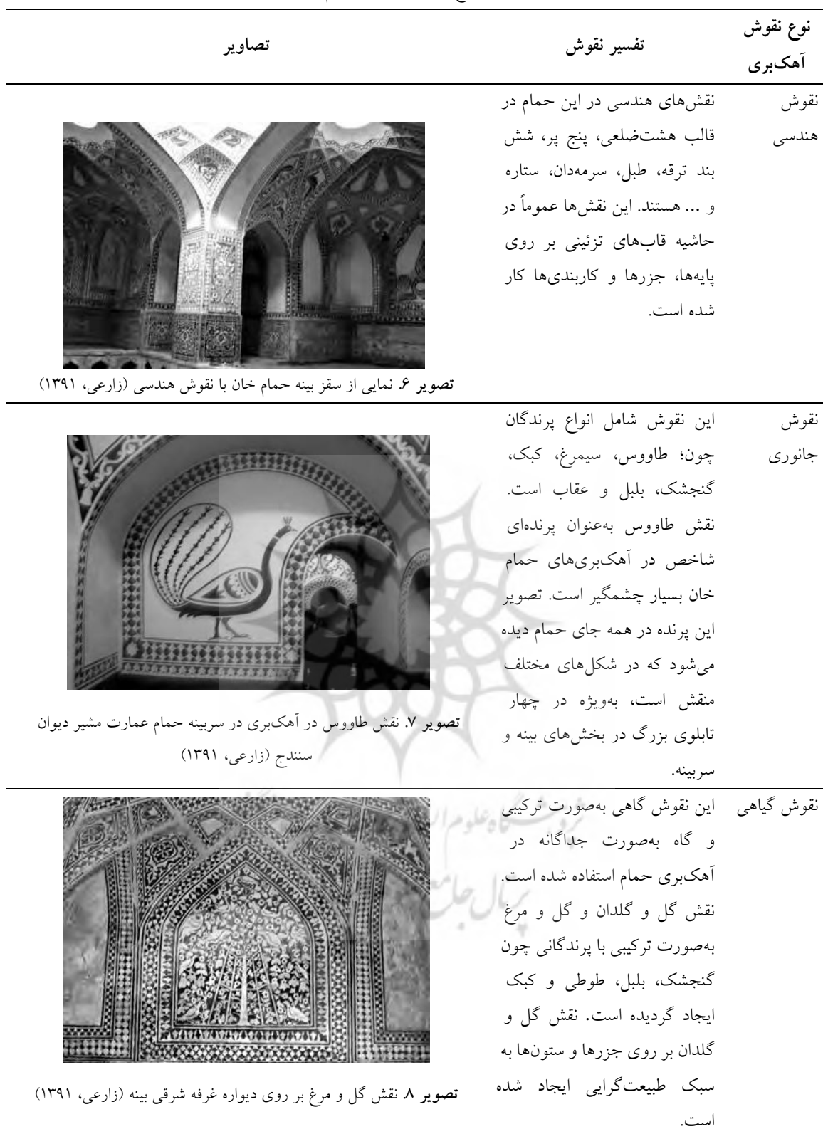
تصویر ۶: نمایی از سقز بینه حمام خان با نقوش هندسی (زارعی، ۱۳۹۱)