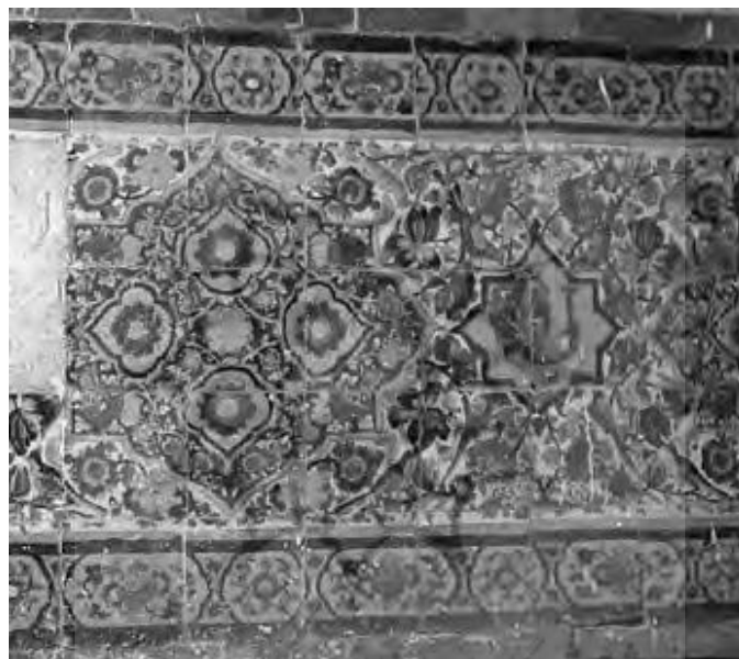
تصویر ۱۰. کاشی کاری سوی دیگر ازاره‌ی غرفه غربی بینه حمام خان با نقش طاووس در مرکز (زارعی، ۱۳۹۱)

درواقع مساجد را باید نخستین کانون اعتقادی، سیاسی و اجتماعی بیان کرد که پس از فتح هر منطقه بنا شده‌اند. بنیاد مساجد جدید اقتباسی بود از همان معماری شناخته شده مسجدالنبی که این تقلید به صورت یک سبک و شیوه خاص برای معماری مساجد تثبیت و به عنوان محور اصلی ساختمانی پذیرفته شد و در طول سالیان دراز تکامل یافت و عناصر جدیدی ابداع یا به آن اضافه شد؛ مانند نمونه‌هایی از مساجد جهان و ایران که بر همان سبک و شیوه بنا شد. آنچه مساجد صدر اسلام را برای پیگیری یک تفکر از دیگر کاربری‌ها ممتاز می‌دارد، در وهله نخست، نداشتن سابقه تاریخی در بستر فرهنگی معماری ایران و نیاز به دست زدن به تألیف است. از دیگر منظر به واسطه اینکه مسجد دارای پایگاه ایدئولوژیک است، به طراحی نیاز دارد. اهمیت این امر درباره فضای عبادی که تازه وارد جغرافیای ایران شده، دوچندان خواهد شد. علاوه بر همه این‌ها، مسجد یا هر فضای عبادی دیگر به نوعی بیانیه معماری دینی محسوب می‌شود. شاید برای معمار فرصت کافی برای شناخت دین نو فراهم نبوده است و در طراحی‌های خود تنها به شنیده‌ها و اخبار می‌توانست استناد کند. بعد مسافت و دوری راه از یک سو و نیاز به فضای عبادی از سوی دیگر و نبود الگوی عبادی مناسب برای مسلمانان دلایلی بودند که به احتمال زیاد با استناد به روایت رسیده از تنها الگوی مسجدالنبی، معماران ایرانی دست به طراحی ساخت مسجد بزنند (آئینی، افضلیان، اعتصام و شریعت‌راد، ۱۴۰۰).