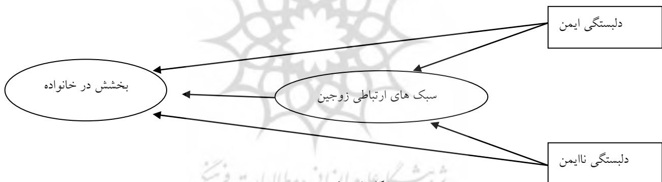
شکل ۱- مدل مفهومی پژوهش

با توجه به آنچه بیان شد و اینکه تاکنون روابط این متغیرها در قالب مدل علی موردبررسی قرار نگرفته است. این پژوهش به دنبال بررسی روابط بین سبک‌های دل‌بستگی ایمن و نایمن، الگوهای ارتباطی زوجین و بخشش در خانواده در زنان متأهل در قالب یک مدل علی است. با توجه به آنچه بیان شد مسئله پژوهش این است که سبک‌های دل‌بستگی ایمن و نایمن هم به‌طور مستقیم و هم با واسطه الگوهای ارتباطی زوجین می‌توانند بخشش در خانواده را در زنان متأهل پیش‌بینی می‌کنند؟