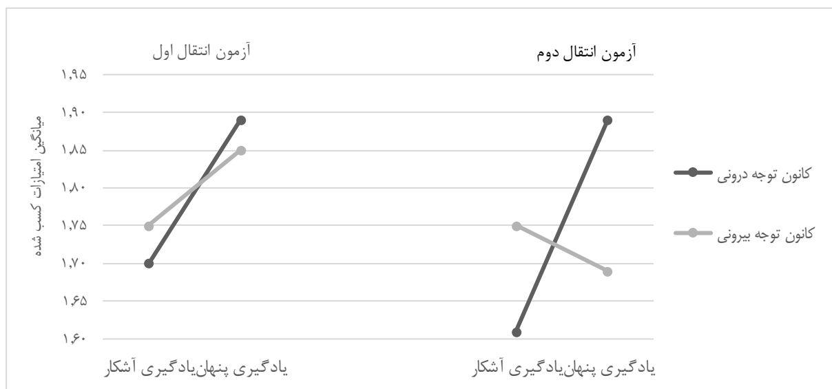
شکل ۳. نمودار عملکرد گروه‌های تحقیق در طی آزمون‌های انتقال