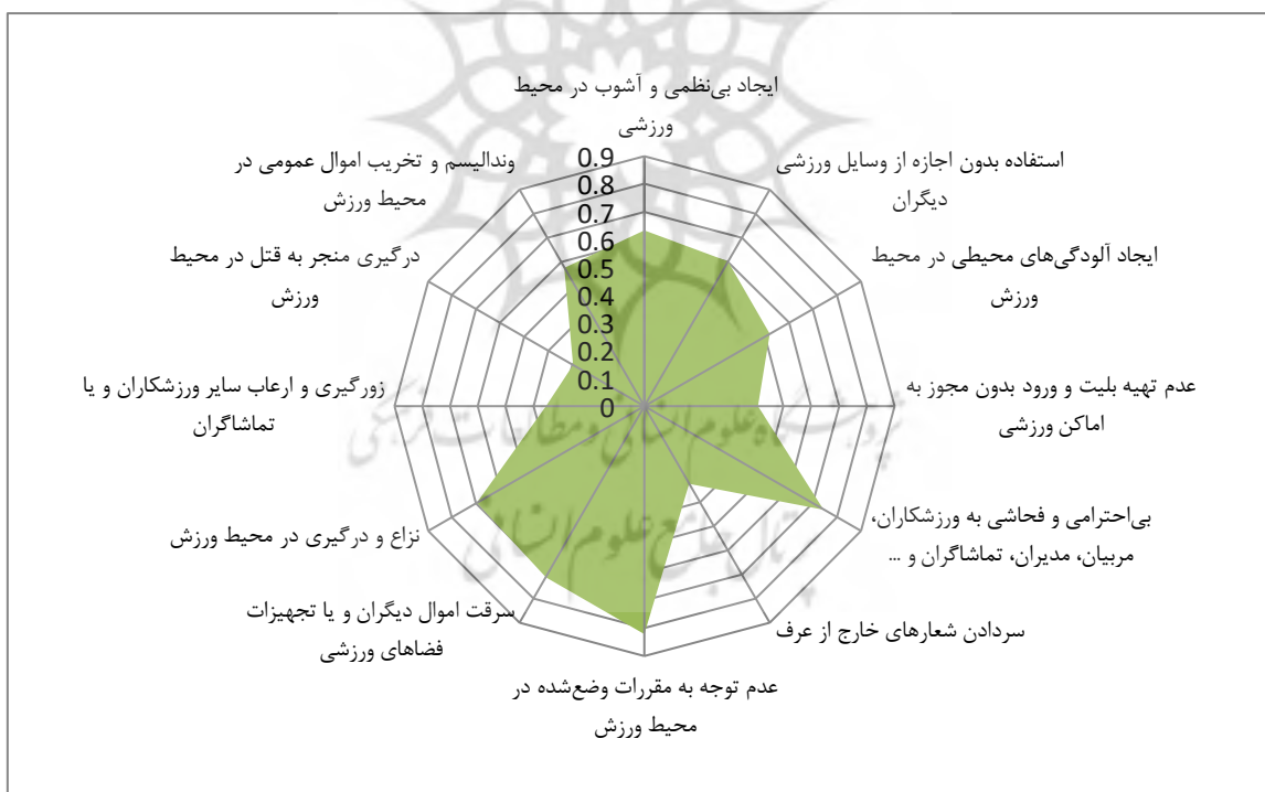
شکل ۲- نمودار رتبه‌بندی جرایم اجتماعی در محیط‌های ورزشی براساس وزن نهایی حاصل از روش TOPSIS

با توجه به ضریب همبستگی رتبه‌ای اسپیرمن به دست آمده معلوم می‌شود که بین دو روش مورد استفاده چه در حالت کلی و چه در حالت جزئی همبستگی بالایی وجود دارد. که این خود نشان دهنده میزان بالای هماهنگی بین نتایج حاصل شده از دو روش مورد استفاده برای اولویت‌بندی در این تحقیق است (جدول ۳).