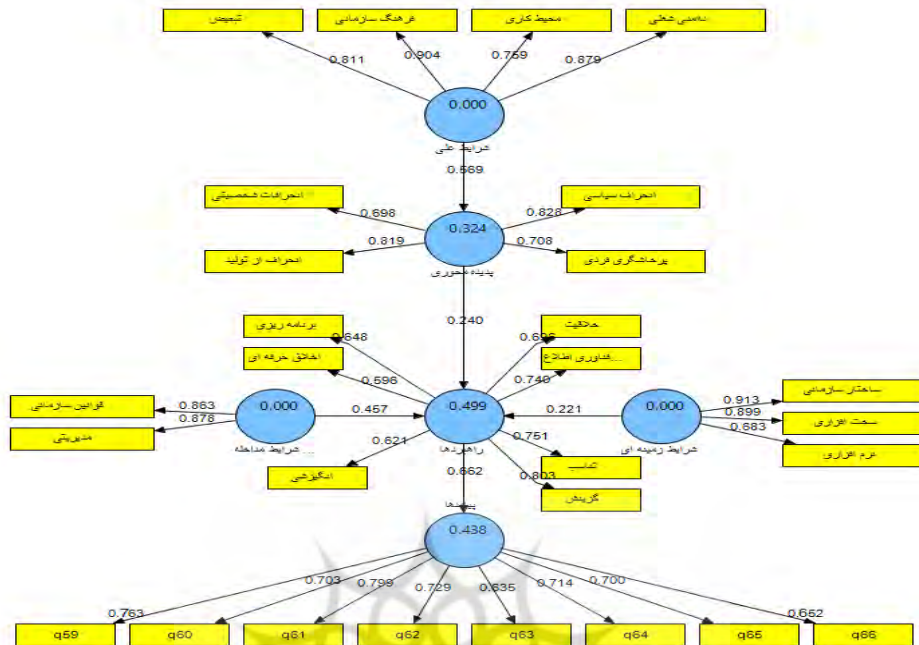
شکل ۲. مدل اندازه‌گیری (بررسی ضرایب مسیر مدل پژوهش)

بیشتر از واریانس اشتراکی بین آن متغیر و متغیرهای دیگر در مدل باشد، مورد تأیید قرار گرفت. بعد از بررسی برازش مدل‌های اندازه‌گیری نوبت به برازش مدل ساختاری پژوهش می‌رسد. همان‌گونه که قبلاً اشاره شد، بخش مدل ساختاری برخلاف مدل‌های اندازه‌گیری، به سؤالات (متغیرهای آشکار) کاری ندارد و تنها متغیرهای پنهان همراه با روابط میان آن‌ها بررسی می‌گردد.