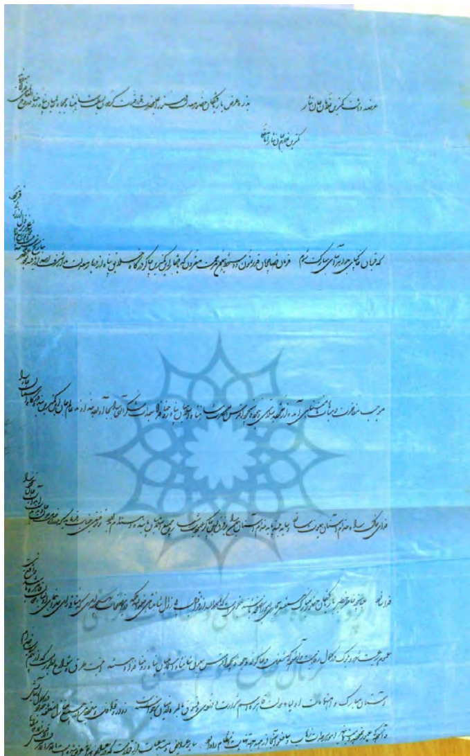
(ساکما، پرونده شماره ۲۹۵/۷۳۹۰)