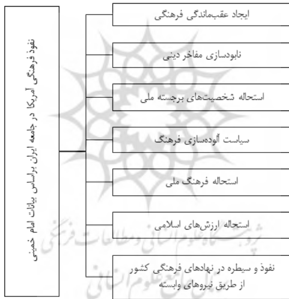
شکل شماره ۳. شیوه و راهبردهای نفوذ فرهنگی در جامعه ایرانی براساس بیانات امام خمینی

در راستای همین سیاست بوده که علاوه بر اقتصاد، سیاست و امور نظامی، آمریکا در امور فرهنگی ایران نیز مداخله و نفوذ داشته است (صحیفه امام، ج ۴: ۴۶۵). برخی از گزاره‌های استخراج‌شده از بیانات امام خمینی در زمینه نفوذ فرهنگی آمریکا به شرح زیر است: آمریکا بر نهادهای فرهنگی ایران سیطره داشته است؛ آمریکا در صدد نابودی مفاخر اسلامی و ملی ایرانیان است؛ و آمریکا عامل استحاله فرهنگ دینی و ملی ایران بوده است.