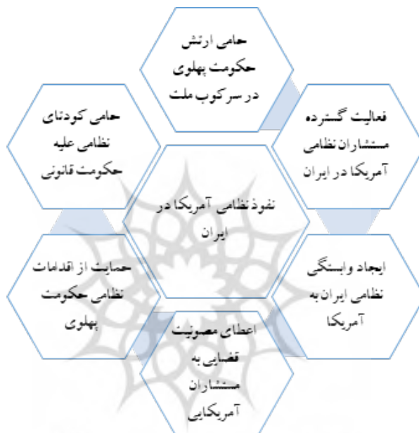
شکل شماره ۴. راهبردهای نفوذ نظامی آمریکا در ایران براساس گفتارهای امام خمینی (یافته‌های پژوهش)

به قرار زیر است: آمریکا در ارتش ایران نفوذ داشته است؛ آمریکا حامی ارتش پهلوی در سرکوب ملت ایران بود؛ آمریکا حامی کودتای نظامی علیه ملت ایران بوده است؛ حمایت نظامی آمریکا از حکومت پهلوی عامل ماندگاری استبداد در ایران شد؛ مستشاران آمریکایی در حمایت از حکومت پهلوی فعالیت داشتند؛ و آمریکا عامل وابستگی نظامی ارتش ایران بوده است.