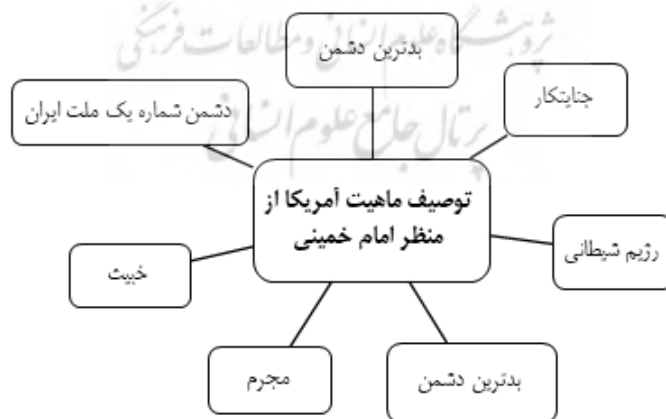
شکل شماره ۲. توصیف ماهیت آمریکا در گفتار و اندیشه امام خمینی (یافته‌های پژوهش)

کدهای استخراج‌شده از صحیفه امام پیرامون ماهیت آمریکا نشان می‌دهند ذات استثماری و جوهره استعماری آمریکا در گفتار امام خمینی با واژگانی همچون «وحشی»، «شیطانی»، «خبیث»، «منفورترین کشور»، «جنایتکار»، «بدترین دشمن»، «دشمن شماره یک ملت ایران»، «مجرم» و غیره توصیف شده است.