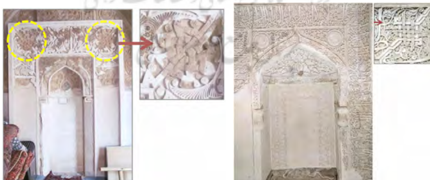
تصویر ۱۱. محراب مسجد جامع تربت جام (صالحی کاخکی و تقوی‌نژاد، ۱۳۹۶: ۶۱)