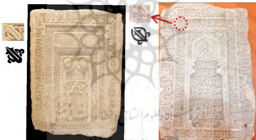
تصویر ۳. محراب قدمگاه فراشاه (منبع: نگارنده) تصویر ۴. سنگ قبر سلجوقی (منبع: نگارنده)

اثر مورد بحث بعدی (تصویر ۴) در سالیان گذشته از سارقین میراث فرهنگی توقیف شده و محل کشف آن نیز نامشخص است (پورداد و همکاران، ۱۴۰۱: ۹۴). در کتیبه حاشیه دوم آن آیه ۴۱ سوره فلصت «بسم الله الرحمن الرحيم أن الذين قالوا ربنا الله ثم استقاموا تتنزل عليهم الملائكة الا تخافوا و لاتحزنوا و الشرو بل...» به نگارش در آمده است. در این اثر نیز همچون آثار پیش گفته، بدون ارتباط با متن آیه، دو «لا» در میان نقشی اسلمی مانند پراتنز که می توان آن را شکل کامل عبارت مورد بحث (لا اله الا الله) نیز دانست، در دو گوشه سمت