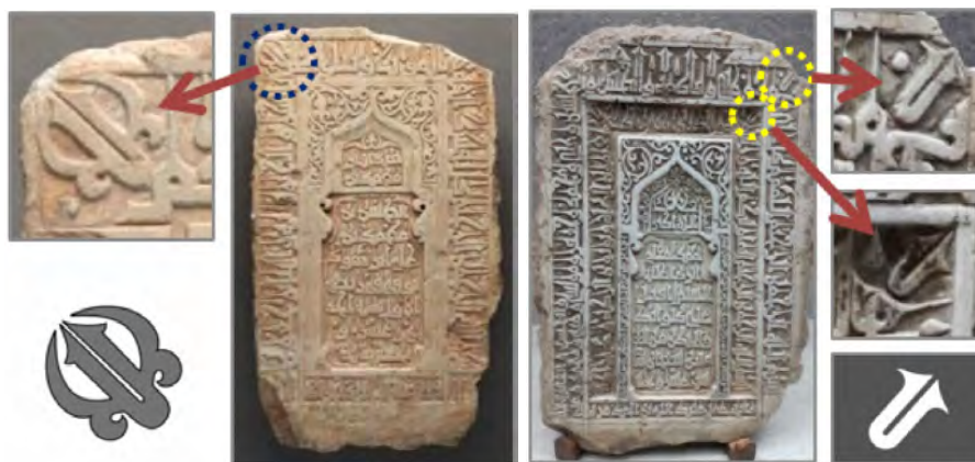
تصویر ۱. لوح سنگی آستان قدس رضوی (صالحی کاخکی و تقوی نژاد، ۱۳۹۶: ۵۹)

فصلنامه علمی تاریخ اسلام و ایران دانشگاه الزهراء(س)، سال ۳۲، شماره ۵۶، زمستان ۱۴۰۱ / ۵۷