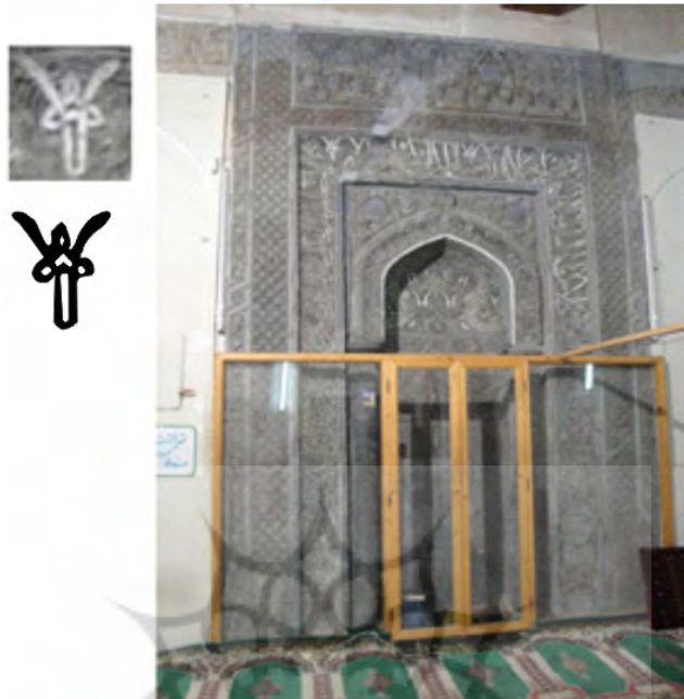
تصویر ۱۳. محراب مسجد آرامگاه بایزید بسطامی