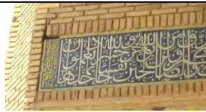
● تصویر (۲۶)، کتیبه شبستان‌های شمالی مسجد.