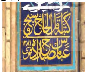
● تصویر (۲)، کتیبه‌ی سر در ورودی مسجد جامع قم.

بورکهارت درباره کتیبه‌نگاری و تزئینات آن معتقد است: «تکرار کتیبه‌های مأخوذ از آیات قرآن کریم روی دیوارهای مساجد و سایر ساختمان‌ها، انسان را یادآور این حقیقت می‌کند که تار و پود حیات اسلامی از آیات قرآنی تنیده شده و از لحاظ معنوی بر قرائت قرآن و نماز و اوراد و اذکاری متکی است که از کتاب آسمانی اخذ شده است». (رضایی، طیبیان، ۱۳۹۷: ۸) بنابراین کاربرد آیات قرآن کریم در تزئینات مسجد به عنوان یک مکان مقدس بر اهمیت جایگاه مفاهیم کلام الهی در