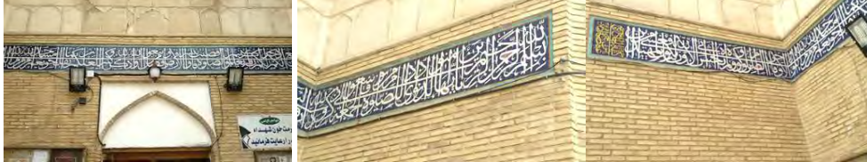
● تصویر (۳)، کتیبه‌ی سر در ورودی مسجد ● تصویر (۴)، کتیبه‌ی سردر ورودی مسجد ● تصویر (۵)، کتیبه‌ی سر در ورودی مسجد