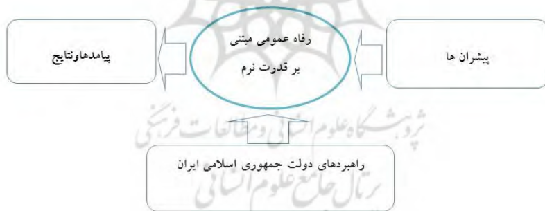
شکل ۱: چارچوب مفهومی تحقیق