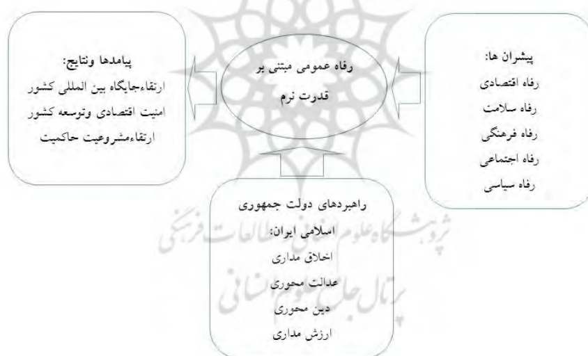
شکل ۲: الگوی رفاه عمومی مبتنی قدرت نرم

بر اساس نتایج حاصل از تحلیل تم و نظرخواهی از خبرگان، مدل تحقیق طراحی گردید. در مدل تحقیق علاوه بر راهبردها که مبتنی بر ابعاد و مولفه های قدرت نرم است و ابعاد متغیر رفاه، پیامدهای حاصل از رفاه عمومی بارویکرد قدرت نرم که در مصاحبه ها به آن ها اشاره شده بود، ارائه شده که در شکل ۲ قابل مشاهده است.