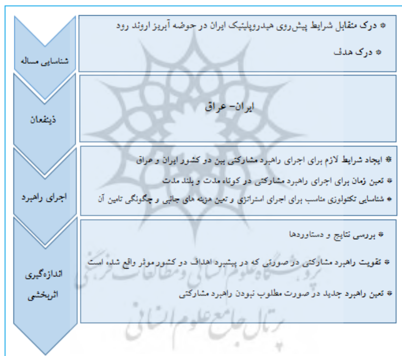
شکل ۵. مراحل اجرای راهبرد مشارکتی در هیدروپلیتیک حوضه آبریز اروندرود بین ایران و عراق

بیشتر در منطقه، مناسب این سطح از مناسبات آینده فراروی هیدروپلیتیک ایران در حوضه آبریز اروندرود، راهبرد مشارکتی بین دو کشور ایران و عراق و کشورهای حوضه دجله و فرات است. در این راهبرد به منظور شکل‌گیری همکاری و مشارکت میان ذی‌نفعان در یک حوضه آبریز، وضعیتی پدید می‌آید که موجب بهبود وضعیت پیش‌رو می‌شود. از نقاط قوت این راهبرد شمار زیاد بازیگران و کنشگران (افراد، گروه‌ها و سازمان‌ها) در روند مشارکت برای تصمیم‌گیری است که در نتیجه دیدگاه‌ها و برداشت‌های بیشتری در اختیار کارگزاران قرار می‌گیرد و از خطاهای پیش‌رو تا حد ممکن جلوگیری می‌شود. راهبرد مشارکتی در بلندمدت به توسعه کشورهای ذی‌نفع در کنار یکدیگر و در نتیجه شکل‌گیری ارتباط قوی بین آنها می‌انجامد که اعتماد متقابل در سیاست خارجی آنها را به همراه دارد.