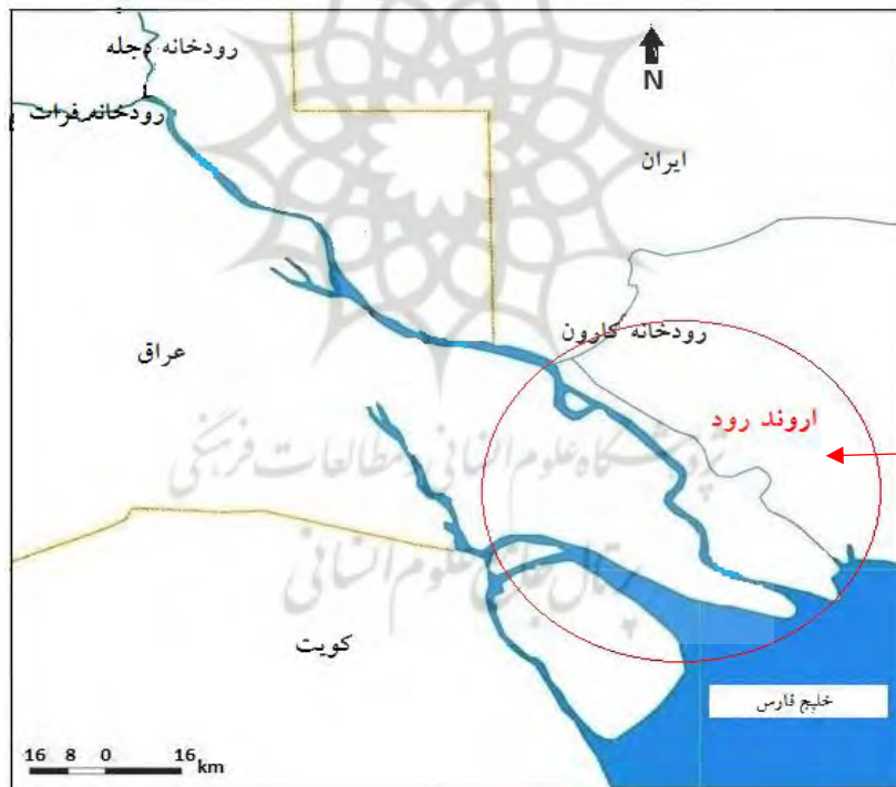
شکل ۱: محدوده مورد مطالعه

از رودخانه‌های دجله، فرات، کارون و کرخه تأمین می‌شود. با این دید، ایران نسبت به عراق در حوضه آبریز اروندرود در شرایط پایین‌دست- بالادست قرار دارد. پایین‌دست به این علت که سرچشمه اصلی اروندرود از پیوستن دو رود دجله و فرات در قرنه عراق که از ترکیه سرچشمه می‌گیرند و بالادست به این علت که بخشی از آب اروندرود از رودهای کارون و کرخه تأمین می‌شود که از ایران سرچشمه گرفته است. افزون بر اهمیت زیست‌محیطی و معیشتی اروندرود، این رودخانه به علت آنکه بخشی از مرز دو کشور ایران و عراق را تشکیل می‌دهد و راه اصلی عبور کشتی‌های نفتی عراق و تجاری ایران است، برای دو طرف حائز اهمیت است. از آنجا که این آبراهه به همراه خور عبدالله تنها مسیری‌هایی هستند که عراق را به آب‌های آزاد متصل می‌کنند، برای عراق اهمیت راهبردی بالایی دارد چراکه استفاده از خور عبدالله نیازمند لایروبی مداوم است و عراق در خور عبدالله با کویت مرز مشترک دارد و لایروبی این خور برای کویت اهمیت چندانی ندارد در نتیجه انجام لایروبی مشترک و دائمی را برای خود ضروری نمی‌بیند (واتق و نجفی، ۱۳۹۸: ۱۱۸).