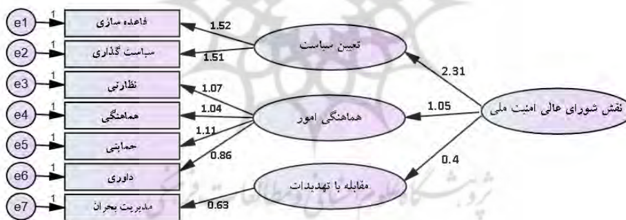
شکل ۱- تحلیل عاملی الگوی کارکردی شورای عالی امنیت ملی

در نهایت به عنوان نتیجه پایانی می‌توان الگوی کارکردی شورای عالی امنیت ملی را ترسیم نمود. این الگو بر ابعاد سه‌گانه کارکردی که ملهم از قانون اساسی است و مؤلفه‌های هفت‌گانه و شاخص‌های زیرمجموعه آن استوار است: