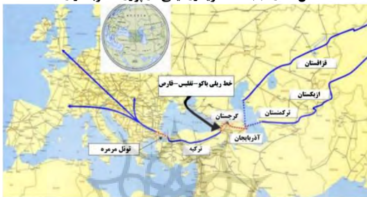
شکل شماره (۱): نقشه کریدور میانی در پروژه کمربند و راه

(منبع: موسوی؛ غفاری و شریعتی، ۱۴۰۰، ص. ۱۳۵)