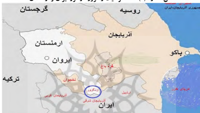
شکل شماره (۲): نقشه موقعیت زنگزور در مرز ایران و ارمنستان

ارتباطی ایران به دریای سیاه و اروپا از طریق خاک ارمنستان و وابستگی ایران به ترکیه و آذربایجان جهت ارتباط با اروپا خواهد شد. پ. عدم احیاء و حذف سوآپ گاز ترکمنستان به ترکیه از مسیر ج.ا.ایران که منجر به کاهش اهمیت و نقش ژئوپلیتیکی ایران خواهد شد.