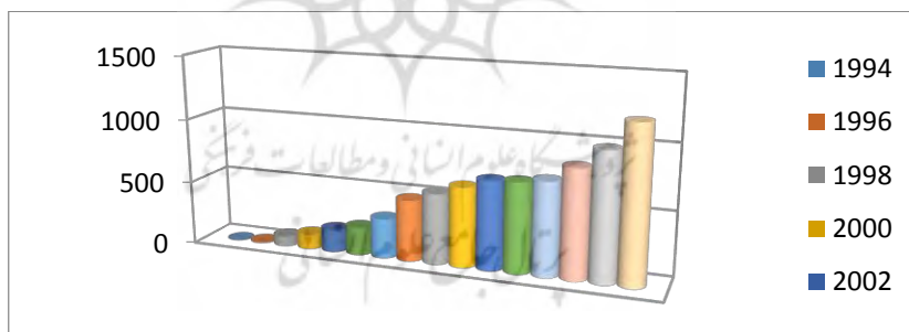
شکل ۳. روند رشد تجمعی سرمایه‌گذاری خارجی در اروپای مرکزی و شرقی از سال ۱۹۹۰ تا ۲۰۲۰ در میلیارد دلار