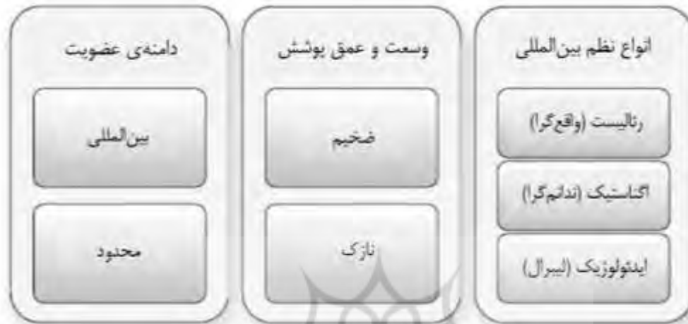
شکل ۱ - انواع نظم بین‌المللی از نظر میرشایمر

نظم جهانی، در صحنه‌ی واقعیت و روی زمین، یک سیر تاریخی را سپری کرده است و در دوره‌های مختلف، اشکال و صورت‌بندی‌های مختلفی را بر خود دیده است. سیر تاریخی نظم جهانی، در دوره‌ی پس از قرون میانه در اروپا، که بعدتر به کل جهان توسعه پیدا کرده است، در جدول زیر ارائه شده است.