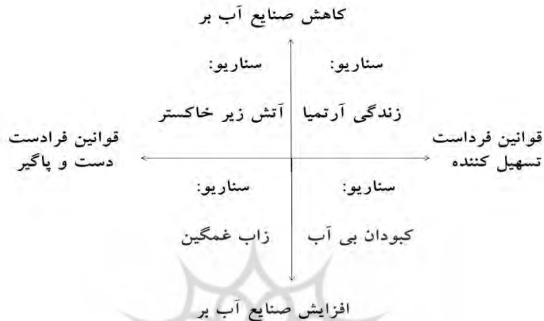
شکل ۳: ماتریس سناریوهای اصلی پیامدهای انتقال آب از حوضه زاب

بعد از تبیین سناریوها با رجوع به موضوع و هدف اصلی پژوهش، مطلوبیت هر یک از سناریوها مورد بررسی قرار می‌گیرد (نوازی و همکاران، ۱۴۰۰: ۲۳).