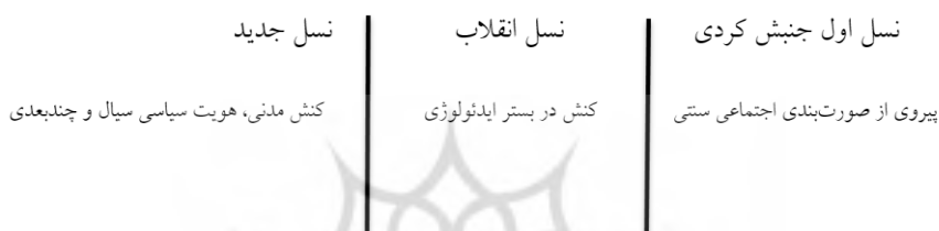
شکل شماره ۵: شکاف نسلی در میان کُردها

اکنون جامعه کُردی درگیر شکاف‌های متمایزتری نسبت به نسل‌های قبل است که بیشترین نمود آن در تمایز در سبک زندگی است (مصاحبه با حق‌پناه، ۱۴۰۱/۰۶/۲۵). نتایج پژوهشی میدانی در سندج نشان می‌دهد که هویت نسل امروز هویتی سیال‌تر است (توسلی و ادهمی، ۱۳۹۱: ۷). با توجه به شرح اجمالی که از تحولات نسلی در میان کُردها گذشت، می‌توان الگوی زیر را برای تحول رفتارها در هر نسل ترسیم کرد.