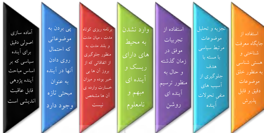
نمودار شماره ۲. اهداف آینده پژوهی سیاسی (عیوضی، ۱۳۹۵: ۱۸۱)

با توجه به آنچه اندیشمندان در زمینه‌ی مطلب مذکور عنوان کرده‌اند، از نخستین دوران پیدایش مفاهیم علم سیاست، هر آنچه مرتبط با آینده‌ی این علم بوده است نیز مورد توجه بزرگان قرار داشته است. آن‌ها هدف از پرداختن به این مهم را عبور از وضع موجود و رسیدن به وضعیتی بهتر و مساعدتر عنوان کرده‌اند (اسپرینگز، ۱۳۷۰: ۱۴۳). اهمیت آینده پژوهی در علم سیاست را می‌توان از این بُعد نیز مورد بررسی قرارداد که این مهم قادر خواهد بود فضایی مناسب را جهت به وجود آوردن جلوه‌ای جدید از آینده‌ای سعادت‌مند را در فکر اندیشمند پدید آورد تا وی بتواند با ترسیم نقشه‌ای دقیق در ذهن خود، جامعه‌ای مطلوب از نظر سیاسی را پی‌ریزی نماید. درنهایت آینده پژوهی سیاسی را می‌توان چنین تعریف کرد که این مبحث به دنبال ترسیم آینده‌ای روشن به‌منظور رهایی از موضوعات و چالش‌هایی است که قادر خواهند بود در آینده جامعه را چه در بُعد داخلی و چه در بُعد خارجی درگیر خود نمایند. آینده پژوهی سیاسی با استفاده از شیوه‌های روش‌شناسی علمی قادر خواهد بود تا چراغ‌های آینده را پیش روی مخاطب خویش به‌درستی و با تحلیل‌های قابل‌پذیرش و علمی روشن نموده و کمک بسیار بزرگی به پیش‌برد اهداف مردان سیاست در تصمیم‌گیری‌هایشان داشته باشد.