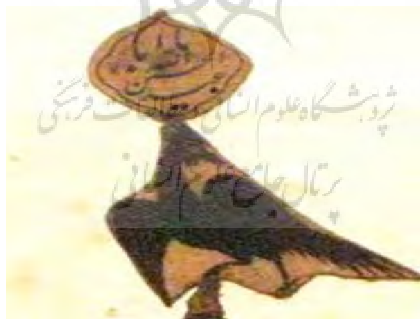
تصویر ۴. متن کلامی یا ابا عبدالله الحسین بر روی پرنده (نگارنده)

پس از ورود مردم-در هر روزه تعداد محدودی وارد می‌شوند، سپس درب بسته می‌شود، روزه که تمام شد افرادی که وارد شده بودند خارج و گروه بعدی وارد می‌شوند- و قرار گیری آنها در حیاط یا حجره‌ها، روزه خوان شروع به بیان مصیبت کربلا می‌کند، پس از آنکه روزه وی به میانه رسید، وی عمامه از سر بر می‌دارد و پیری را با پوشش سبز بر منبر می‌نشانند و روزه‌خوانی را ادامه می‌دهد (تصویر ۵).