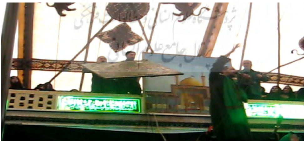
تصویر ۶. تابلوی نمایشی که توسط افراد از طبقه بالا به دست روحانی داده می‌شود

در هنگام اوج روضه‌خوانی و انتهای مراسم، یک تابلوی نقاشی قهوه‌خانه‌ای از بالا به پایین فرستاده می‌شود. این تابلو که شمایی بر روی آن نقش بسته است با توجه به روضه هر روز متفاوت است و بیشتر در بردارنده تصویری از امام حسین و یاران وی است. برای لحظاتی کوتاه تابلو نمایش داده می‌شود و پس از آن دوباره به بالا فرستاده می‌شود، این هنگام اوج عزاداری است و با دیدن تابلو مردم شیون می‌زنند (تصاویر ۷ و ۶) و پس از شیون، ناگهان مجلس آرام می‌گیرد. نوحه‌خوان روضه را به پایان می‌رساند و گروهی که وارد شده بودند مجلس را ترک می‌کنند.