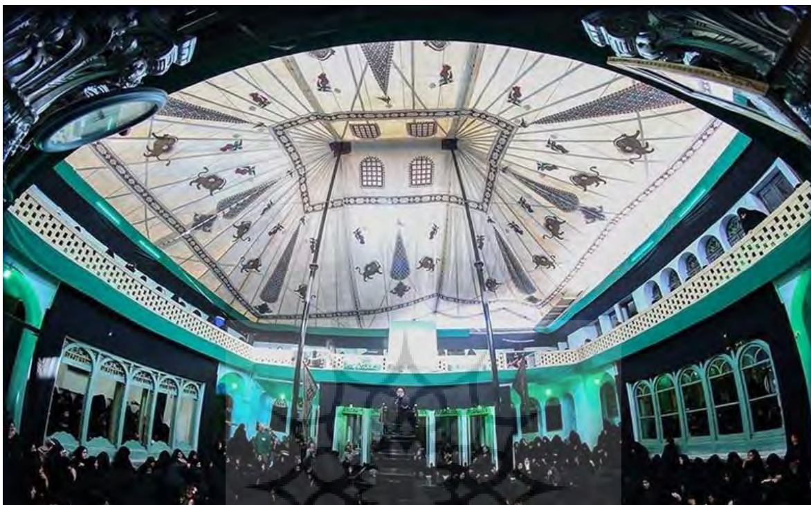
تصویر ۳. پوشش سقف از پارچه قلمکار.