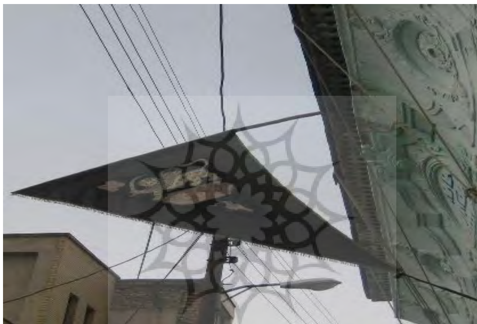
تصویر ۲. پرچم ورودی خانه.

پس از ساعت‌ها انتظار، قبل از ورود به خانه مردم باید از زیر پرچمی عبور کنند که تصاویری از شیر و خورشید، پرنده و دو کتیبه شبیه کتیبه‌های قلمدانی با نقوش انتزاعی در آن نقش بسته است (تصویر ۲). اصل مراسم در طبقه همکف برگزار می‌شود با این وجود به دلیل حجم بالای مردم، افرادی که عجله دارند و نمی‌خواهند مانند دیگران زمان بسیار زیادی در صف باقی بمانند به طبقه دوم می‌روند که تعداد محدودی هستند. چرا که کسانی که به طبقه دوم می‌روند از آنجا که با بسیاری از این نمادها مواجه نمی‌شوند عمق مراسم را نیز درک نخواهند کرد؛ بنابراین تأکید بر کسانی است که در طبقه همکف هستند.