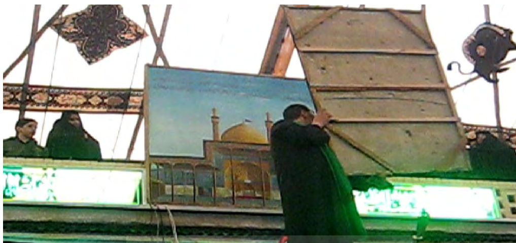
تصویر ۷ بازگرداندن تابلو