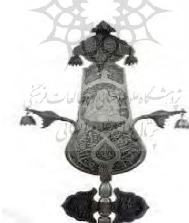
تصویر ۸. نماد سرو در علم (ماهوان، ۱۴۰۰: ۱۹۶)

از جمله نقش‌مایه‌های گیاهی، درخت سرو است؛ از جمله نگاره‌های بسیار رایج و تکراری است که قدیمی‌ترین نشانه آن در تخت جمشید به جهت آیینی مشاهده می‌شود. این نقش با آیین زرتشتی و سنن باستانی ایران همبستگی خاص دارد. درخت همیشه سبز سرو نشانه‌ای از جاودانگی روح و زندگی دائم است. درخت سرو نشانه و نمادی از حالت‌های مفرح روح و مثبت زندگی است، همچنین بیانگر زندگی مذهبی نیز است؛ بنابراین شاهد حضور کثرت درخت در مکان‌های مقدس می‌توان بود (غروی، ۱۳۵۲: ۱۷۴). برخی از محققین نیز اعتقاد دارند که درخت سرو در دوران باستان نماد جاودانگی بوده و جنبه آیینی داشته است؛ به‌علاوه سرو را نماد آزادگی امام حسین (ع) و همراهان و یارانش نیز دانسته‌اند و بعنوان نماد شهادتی شناخته شده که حیات جاوید پیدا کرده‌اند (ماهوان، ۱۴۰۰: ۱۹۰) و از اساسی‌ترین نمادهای علم‌های عاشورا است (تصویر ۸) و سروی که مرکز علم قرار گرفته نمادی از امام حسین (ع) در نظر گرفته شده است (همان، ۱۹۶).