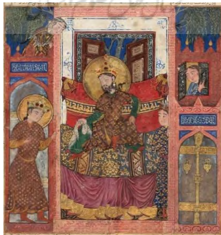
تصویر شماره چهار: سخن گفتن بهرام گور با نرسی، منبع: https://www.clevelandart.org/art/