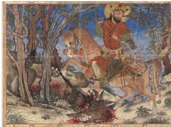
تصویر شماره دو: نبرد بهرام گور با گرگ شاخدار؛ کتابخانه دانشگاه هاروارد، ثبت به شماره ۱۹۶۰.۱۹۰