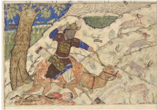
تصویر شماره سه: بهرام گور و آزاده در حال شکار؛ کتابخانه دانشگاه هاروارد، ثبت به شماره ۱۹۵۷.۱۹۳