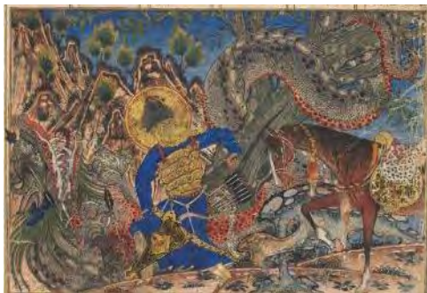
تصویر شماره یک: نگاره بهرام گور اژدها را می‌کشد

در شاهنامه بزرگ ایلخانی تعداد ۵ نگاره به موضوع بهرام گور در موقعیت‌های گوناگون پرداخته‌اند. این نگاره‌ها شامل: ۱- نگاره‌ی بهرام گور اژدها را می‌کشد، موزه‌ی هنر کلیولند، اوهایو. ۲- نگاره‌ی جنگ بهرام گور با گرگ شاخ‌دار، موزه‌ی هنر دانشگاه هاروارد. ۳- نگاره‌ی بهرام گور و آژدها، موزه‌ی هنر دانشگاه هاروارد. ۴- نگاره‌ی سخن گفتن بهرام گور با نرسی، موزه‌ی هنر و تاریخ جنوا، ایتالیا. ۵- نگاره‌ی بهرام گور در خزانه‌ی جمشید، انستیتو اسمیتسون، واشنگتن دی سی. هستند که در ادامه به بررسی آنها پرداخته می‌شود.