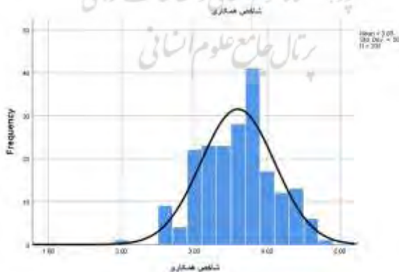
نمودار (۱) شاخص همکاری و تشریک مساعی در صلح دوستی

نمودار زیر توزیع میانگین پاسخگویی را نسبت به توزیع نرمال نشان می دهد: