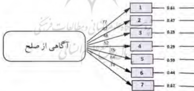
شکل (۱) مدل اندازه گیری آگاهی از صلح با بارهای عاملی استاندارد

مؤلفه آگاهی از صلح: این بخش در واقع نتایج تحلیل عاملی تأییدی هستند و تحلیل عاملی تأییدی روشی برای روایی و پایایی ابزار اندازه گیری می باشد. نتایج مندرج در شکل زیر نشان می دهد؛ هفت نشانگر برای مؤلفه آگاهی از صلح تأیید شده اند. همچنین مقادیر بارعاملی حاکی از مقدار قابل قبول آنها است.