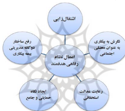
نمودار ۱- مفصل‌بندی گفتمان عدالت اجتماعی حاکم بر بیکاری در قانون بیمه بیکاری

ب) مفصل‌بندی گفتمان عدالت اجتماعی حاکم بر طرح بیمه بیکاری ایام کرونا: سازمان تأمین اجتماعی از ابتدای شیوع کرونا و بر اساس قوانین و مقررات مربوطه و طبق مصوبات مراجع ذیصلاح اقدامات وسیعی را در حوزه حمایت از کارگران و بیکاران ناشی از کرونا صورت داد؛ زیرا با شروع محدودیت‌ها، بسیاری از مشاغل و کسب‌وکارها رونق خود را از دست دادند و درآمد بسیاری از بنگاه‌ها و کسب‌وکارها کاهش یافت که این امر به بیکار شدن بسیاری از افرادی که تا قبل از این به پستوانه اشتغال در این بنگاه‌ها منبع درآمدی داشتند، منجر شد؛ بنابراین باید هرچه سریع‌تر تدابیر و سیاست‌هایی در