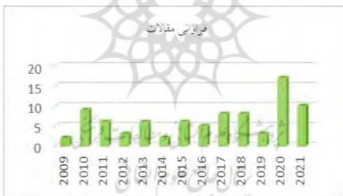
شکل ۲. فراوانی مقالات بررسی

به منظور ارائه اطلاعات احصاء شده از مقالات تحت بررسی، از اشکال ۳ تا ۵ استفاده شده است. این اشکال با استفاده از ابزار پایتون و با هدف نمایش تغییرات مفاهیم اشاره شده توسط مقالات، طی سه بازه‌ی زمانی مختلف ایجاد شده است. شکل ۲ فراوانی مقالات بررسی شده در هر سال را نشان می‌دهد.