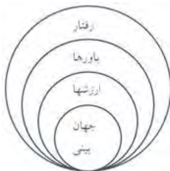
شکل ۲. اجزای تشکیل دهنده فرهنگ

جامعه متحول شود. توسعه فرهنگی یک مفهوم جامعیت و کل گرایی را ترویج می‌کند؛ یعنی توسعه همه جانبه. کلیت فرهنگی شامل جامعه با تمام ساختار آن و زبان اجزای تشکیل دهنده آن و ایدئولوژی با تمامی ساختار درونی آن و فن آوری با تمامی ابعاد آن می‌شود (مهیمنی و همکاران، ۱۳۸۸: ۳۶).