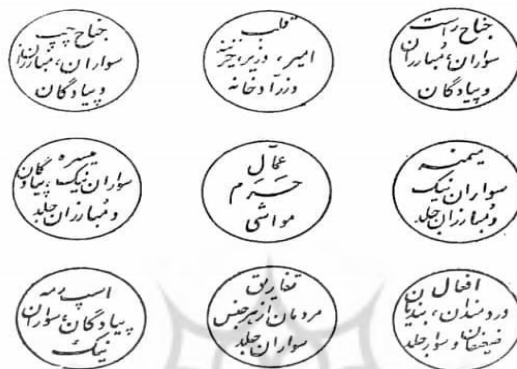
شکل شماره ۱: مصاف پروین (برگرفته از: فخر مدبر، ۱۳۴۶: ۳۲۳).