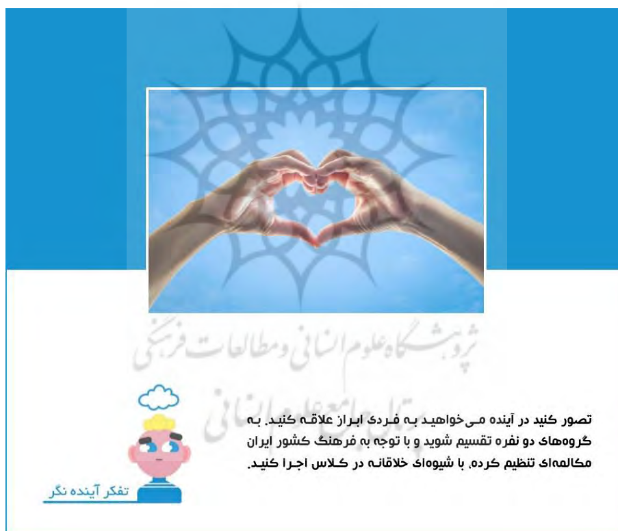
شکل ۶: تمرین تفکر آینده‌نگر

انگیزه و به تبع آن کیفیت یادگیری در فراگیران شود. بنابراین سؤال «این عکس چه کلماتی را در ذهن شما متبادر می‌سازد؟» که با هدف تقویت مهارت گفتن و تفکر سیستمی در زبان‌آموزان طراحی شده است، می‌تواند به صورت یک مسابقه در کلاس‌های مجازی انجام شود و با ایجاد هیجان مثبت در فراگیران آنان را ترغیب به مشارکت کلاسی نمایند. نحوه اجرای این مسابقه به این صورت است که زبان‌آموز شماره یک با توجه به تصویر کلمه‌ای می‌گوید و پس از آن نوبت زبان‌آموز شماره دو است و به همین ترتیب هر یک از افراد کلاس در نوبت خود کلمه‌ای می‌گویند. هر گاه زبان‌آموزی مکث کند از مسابقه خارج می‌شود و این کار تا جایی که فقط یک نفر به عنوان برنده باقی بماند ادامه می‌یابد.