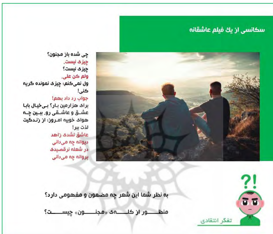
شکل ۳: سکانسی از یک فیلم عاشقانه

کلاسی در فضای الکترونیکی نشان دادن بازخوردی مناسب به آن‌ها است؛ به طور مثال گاه یک کلام مثبت یا محبت‌آمیز تأثیری بلندمدت بر انگیزه فراگیران خواهد داشت.