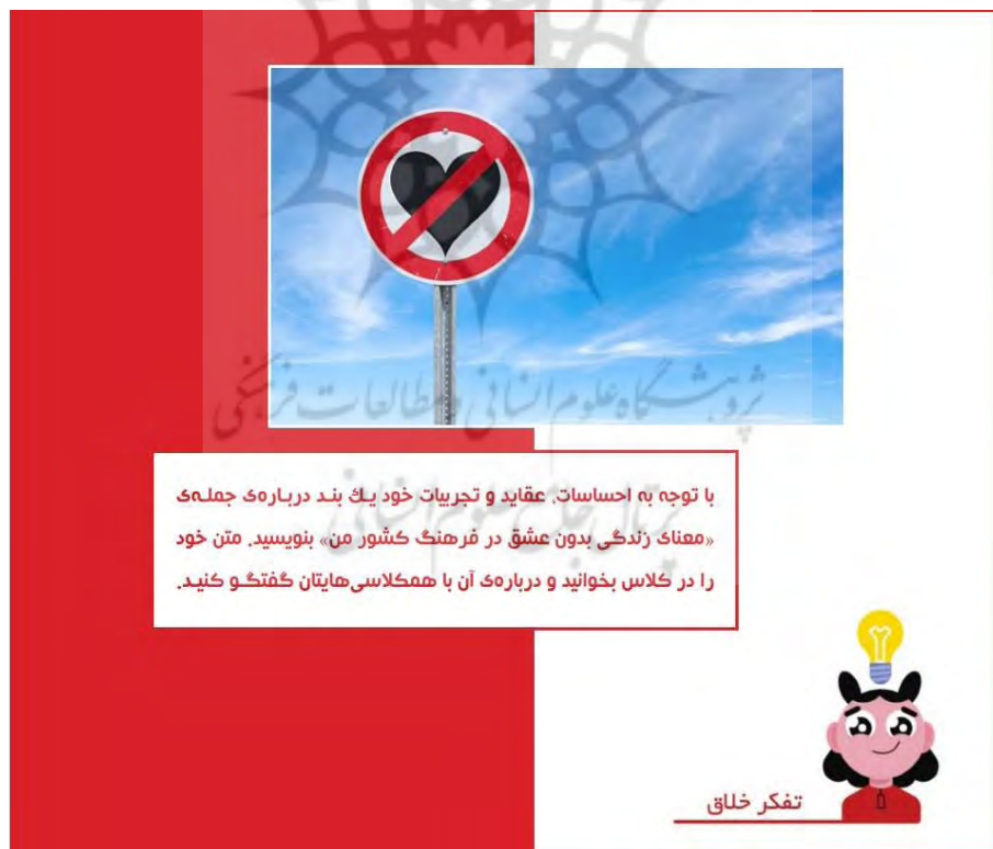
شکل ۷: توجه به احساسات و عقاید در آموزش

زبان آموزان با یکدیگر است، در این نوع از آموزش حائز اهمیت می‌باشد. این تمرین که با هدف تقویت توانایی‌های گفتاری و شنیداری و نیز ارتقای تفکرهای خلاق و آینده‌نگر در فراگیران طراحی شده است، با دور کردن فراگیران از انزوا و ترغیب ایشان به فعالیت گروهی، منجر به بهبود مدیریت درون‌فردی و میان‌فردی آنان نیز می‌شود. در چنین شرایطی زبان آموزان می‌توانند از طریق تماس تلفنی، پیام‌رسان واتساپ و غیره با یکدیگر در ارتباط باشند و متن مکالمه خود را تنظیم کنند. آن‌ها می‌توانند برای خلاقانه نمودن ارائه کلاسی خود روش‌های مختلفی به کار برند. به عنوان مثال استفاده از موسیقی ملایم هنگام مکالمه می‌تواند بر جذابیت کار ایشان بیفزاید. هر چند تصور بر این است که در چنین موقعیت‌هایی توجه تمامی زبان آموزان معطوف به کلاس باشد اما مدرس می‌تواند جهت اطمینان و نیز جلوگیری از منفعل شدن سایر افراد کلاس سؤال یا سؤالاتی تستی از دل مکالمه طرح کند و از سایر زبان آموزان بخواهد به آن پاسخ دهند.