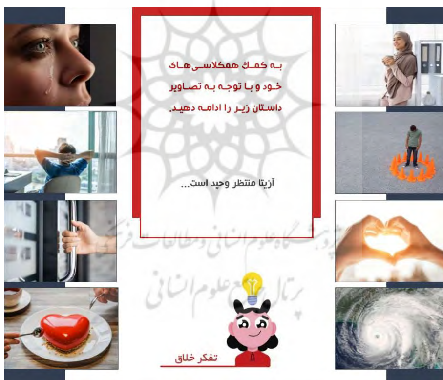
شکل ۴: تمرین داستان‌سرایی

مشارکت کلاسی نمود، طرح سؤالاتی پس از نمایش فیلم با در نظر گرفتن مؤلفه‌های الگوی مفهومی آموزش سودمند به نظر می‌رسد. بنابراین نگارندگان سؤالات «به نظر شما این شعر چه مضمون و مفهومی دارد؟» و «منظور از جمله خیلی مغزتون گرمه چیست؟» را با هدف به چالش کشاندن ذهن مخاطبان و ارتقای تفکر انتقادی ایشان مطرح کرده‌اند. واضح است چنانچه زبان آموزان برای پاسخگویی به چنین سؤالاتی انگیزه لازم را نداشته باشند، دستیابی به هدف مذکور دشوار خواهد شد. بنابراین مدرس می‌بایست راهی جهت انگیزه دادن به زبان آموزان و ترغیب ایشان به فعالیت بیابد. به عنوان مثال در نظر گرفتن یک پوئن مثبت برای شرکت کنندگان در بحث، می‌تواند روشی انگیزه بخش باشد.