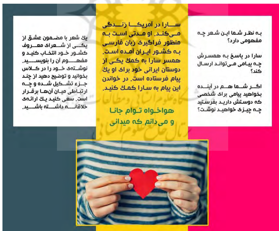
شکل ۹: تمرین انواع تفکر، حواس و هیجان

به نظر می‌رسد یکی از راه‌های تقویت مهارت‌های زبانی استفاده از روایت‌هاست که با استفاده از امکانات موجود در بسترهای آموزش مجازی به راحتی امکان‌پذیر است. واضح است روایت‌ها افزون بر اینکه می‌توانند گوشه‌ای از فرهنگ یک کشور را در خود جای دهند، ضمن درگیر نمودن حواس فراگیران، منجر به افزایش هیجانات مثبت در ایشان می‌شوند. به عنوان مثال روایت فوق در بر دارنده زیانگ‌های «پاره‌گفتارهایی از زبان که بخشی از فرهنگ در آن نهفته است» درباره خواستگاری ایرانی است که ضمن توجه به ارزش‌ها و فرهنگ، حواس و هیجانات فراگیران را نیز درگیر می‌کند. در این راستا به منظور معطوف نمودن توجه مخاطبان به کلاس مجازی و نیز تقویت مهارت‌های زبانی، استفاده از بازی‌های گروهی سودمند می‌نماید. بنابراین بازی گروهی فوق که با هدف تقویت مهارت خوانداری زبان آموزان طراحی شده است با درگیر نمودن هیجانات فراگیران، آنان را ترغیب به مشارکت کلاسی کرده، منجر به بهبود توانایی مدیریت درون‌فردی و میان‌فردی در ایشان می‌شوند و مدرس را در دست‌یابی به اهداف آموزش یاری می‌دهند.