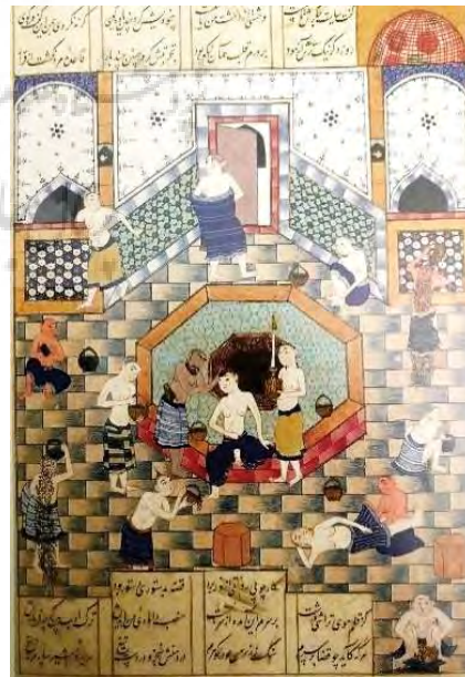
تصویر ۲. خمسه نظامی، هارون در حمام، (۹۴۱ ه.ق)، با کتابت مرشد کاتب شیرازی، توپقاپی سرای استانبول (Uluç, 2006: 275).