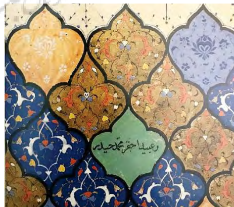
تصویر ۵. جزئی از تذهیب قرآن، با رقم محمدحیدر، توپقاپی‌سرای استانبول (Uluç, 2006: 339).

در بین سال‌های ۹۹۸ تا ۱۰۱۱ ه.ق، در کتاب‌آرایی شیوه صفوی مکتب شیراز تحولاتی رخ داد و روی هم رفته از کیفیت